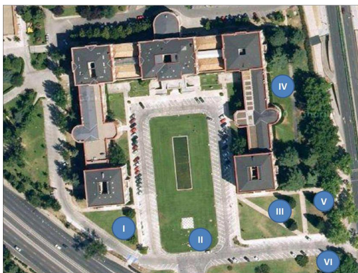
Figura 1. Distribución de las parcelas de muestreo en la ETSIA de Madrid (Fuente: Google Earth).

Ciudad Universitaria: Echium aspernum Lam., Oxalis articulata Savigny, Chelidonium majus L., Paspalum paspalodes (Michx.) Scribn. y Viola odorata L.