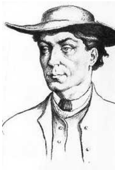
Slika 2. Anton Janša

Tek e 18. stolje e, doba prosvjetiteljstva i preporoda, donijeti zna ajan pomak u razvoju p elarstva. Hrvatska je u to vrijeme bila pod vladavinom Marije Terezije, austrijske carice. U to vrijeme me u vladom se širilo mišljenje kako je podloga bogatstva države samo prihod od zemlje zbog ega je usvojen niz odluka kako bi se poboljšao položaj seljaka. U tu svrhu krenule su se osnivati osnovne škole i poljoprivredna društva koja su bila zadužena za unapre ivanje poljoprivrednih grana me u koje je pripadalo i p elarstvo. Tako je 1770. godine osnovana i prva Glavna p elarska škola u Be u, a za p elarskog u itelja novoosnovane škole postavljen je Anton Janša ( Sl. 2. ). Janša nije preuzeo samo ulogu u itelja, ve je postao i autor potrebnih p elarskih udžbenika. Godine 1771. izdao je knjigu „Rasprava o rojenju p ela“, a 1775. godine, dvije godine nakon Janšine smrti, njegov u enik Joseph Münzberg izdaje njegovo djelo „Potpuno u enje o p elarstvu“. Knjige Antona Janše vlada je razaslala po svim krajevima što je dovelo do širenja svijesti o zna aju p elarstva i do razvitka modernog p elarstva kakvo danas poznajemo (Grupa autora, 1984.)