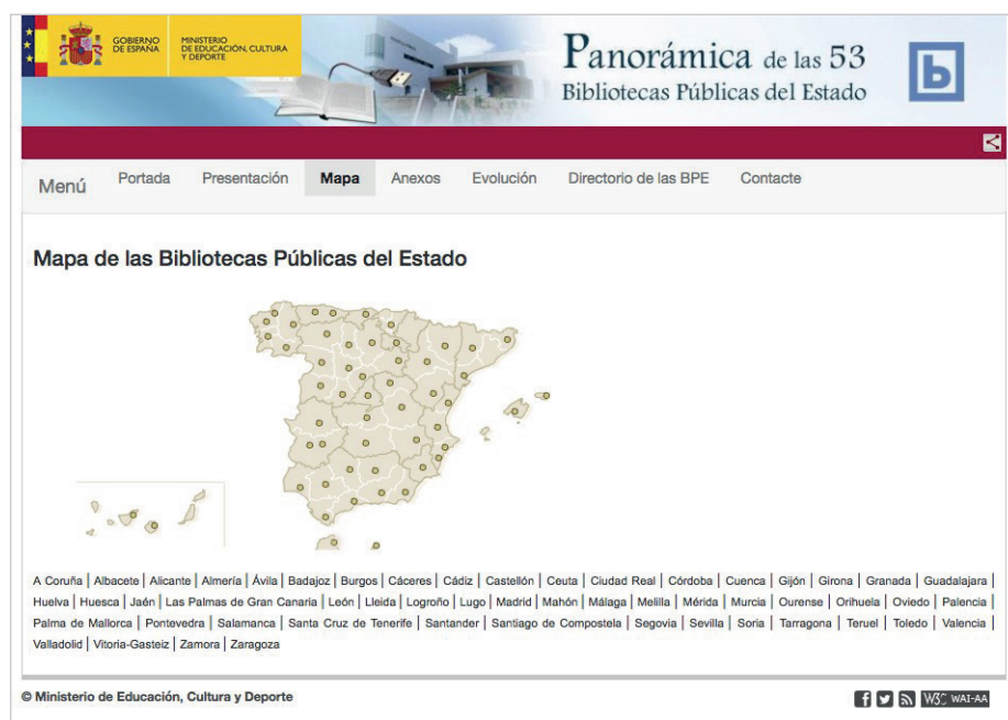
Imagen 1. Mapa desde el que se accede a la web de las 53 BPE http://mapabpe.mcu.es/mapabpe.cmd?command=GetMapa

La localización de los documentos que responden a los indicadores está dispersa en diferentes enlaces. Hay uno que suele recoger, en ciertos casos, la mayoría. Aparece bajo las denominaciones de “La biblioteca”, “Sobre la biblioteca”, “Mi biblioteca” o “Tu biblioteca”. Bajo este enlace se pueden agrupar otros, como el titulado “Quiénes somos”, “Gestión” en el que se encuentran algunos de los documentos. Otra página que contiene documentos es la dedicada a los servicios, en la que se pueden hallar, por ejemplo, las normativas de uso de los mismos.