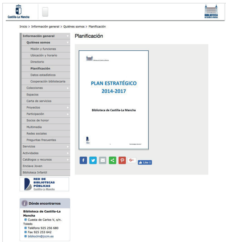
Imagen 2. Web de la Biblioteca Pública de Toledo en la que se encuentran los documentos relacionados con la gestión, en concreto su plan estratégico.

Es el documento más habitual, como también es obvio, destinado a que los usuarios conozcan las reglas de funcionamiento de los servicios que presta la biblioteca, de ahí que esté presente en 46 (86,79%). En este momento es muy corriente encontrar las condiciones de uso de tablets, acceso a internet, salas de trabajo, etc., y, por supuesto, las relacionadas con el préstamo que son las que tienen mayor presencia en el conjunto. Bibliotecas de la misma comunidad autónoma comparten algunos de estos documentos, como el reglamento de préstamo interbibliotecario en las de Castilla la Mancha.