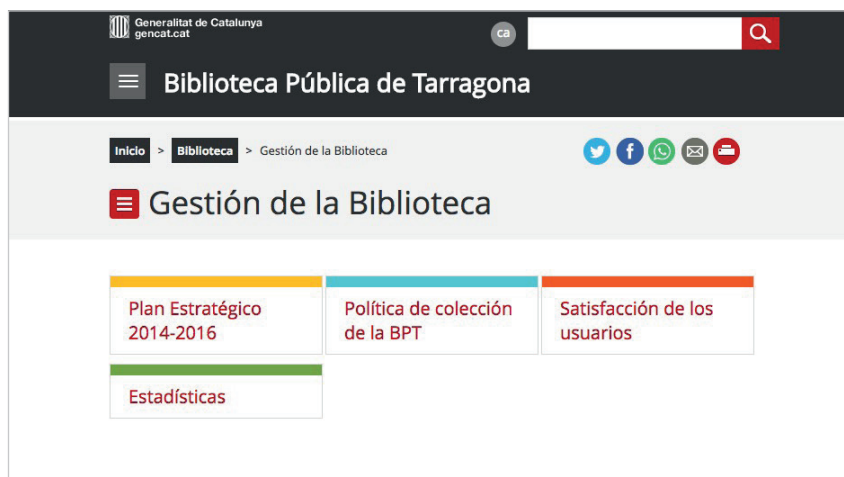
Imagen 3. Página de la Biblioteca Pública de Tarragona con la información sobre la gestión http://bibliotecatarragona.gencat.cat/es/bpt_la_biblioteca/bpt_gestio_de_la_biblioteca

Nos referimos aquí al conjunto de indicadores que la biblioteca elige para medir, generalmente de forma anual, su rendimiento. Son importantes para conocer cómo evolucionan los diferentes ámbitos de análisis, además de permitir la comparación con otras similares o con aquellas que podrían ser consideradas el referente a seguir. Posiblemente el ejemplo más significativo en las públicas haya sido en su momento el conjunto de indicadores del programa PAB ( Programa de análisis de bibliotecas ) que impulsó la Fundación Bertelsmann en el año 1993 que tuvo su continuidad en otros proyectos hasta 2007 (Espinàs, 2001; Felis, 2004, p. 11). Sólo se ha localizado 1 biblioteca (1,89%) que muestre algo similar: Santiago de Compostela . Cuenta con 41 indicadores rela-