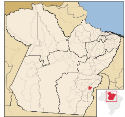
Ubicación del municipio de Sapucaia