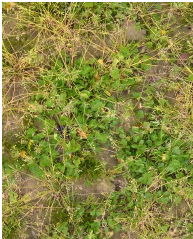
Vlažna tla z velikim deležem Poa annua in Ranunculus repens .

2. Z ene strani se v cikcaku premikajte proti sredini njive. Zabeležite glavne plevelne vrste in pri vsaki na oko ocenite, kolikšen delež tal pokriva. Na listu za vzorčenje zabeležite glavne vrste, ki ste jih našli na prvem vzorčnem podobmočju (npr. "A"). Postopek ponovite na drugem (npr. "B") in na vsakem nadaljnjem podobmočju vzorčenja.