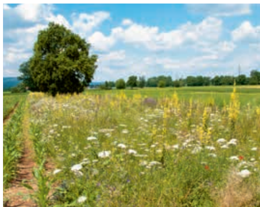
Gli organismi utili riducono quelli nocivi nelle colture vicine.

La produzione di alimenti e la biodiversità possono essere senz'altro combinate – a condizione che si conoscano le connessioni tra le risorse naturali e una produttività duratura. La