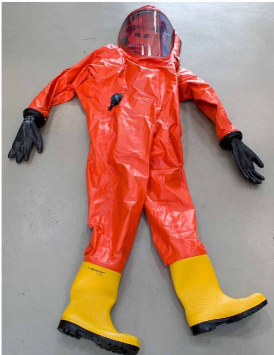
Protichemický oděv typ 1a [40]