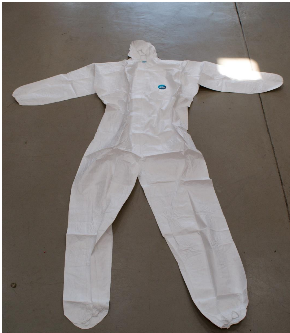
Ptotichemický oděv typ 6 [40]