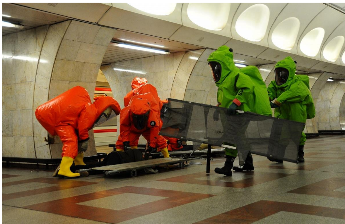
Obrázek 1 Činnost příslušníků HZS hl.m. Prahy v nebezpečné zóně (cvičení Metro 2014) [41]

označována jako jedna z nejnebezpečnějších fází provádění zásahu. Průzkumná skupina v případě výskytu nebezpečné látky musí být vybavena příslušnými osobními ochrannými pomůckami (viz. kapitola 2.2 vybavenost jednotek HZS hl. m. Prahy). Průzkumná skupina je vždy nedělitelná v minimálním počtu dvou hasičů a v případě zásahu s výskytem nebezpečné látky platí pravidlo jistících skupin. Toto pravidlo říká, že dva hasiče jistí další dva, tři hasiče jistí jeden a čtyři hasiči se jistí sami navzájem. Jistící skupina musí být neustále v pohotovosti a schopna poskytnout pomoc v případě nutnosti. Ukázka činnosti jednotek Hasičského záchranného sboru při zásahu s výskytem nebezpečné chemické látky je zobrazena na obrázku 1.