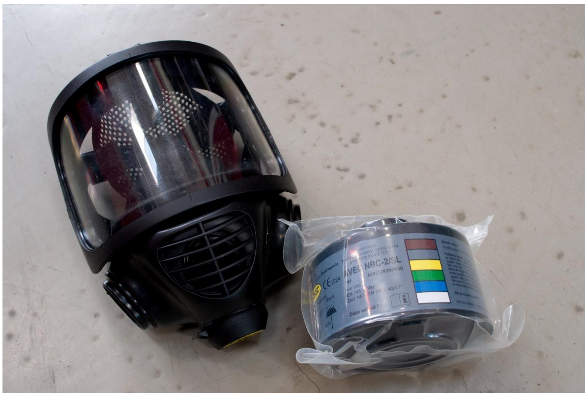
Ochranná maska CM-6 s filtrem NBC-2/SL [40]