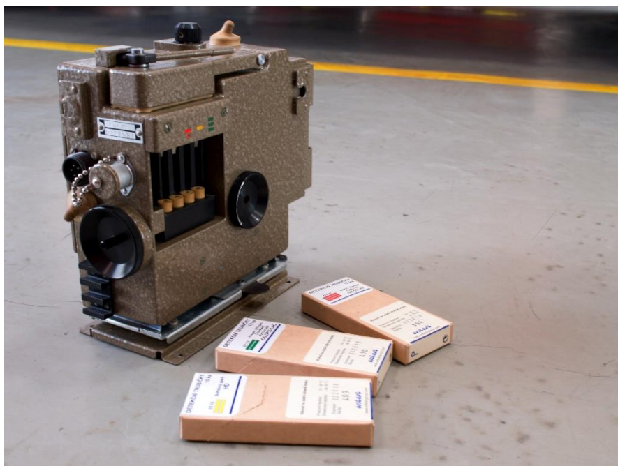
Chemický průkazník CZK-CHP 71 [40]