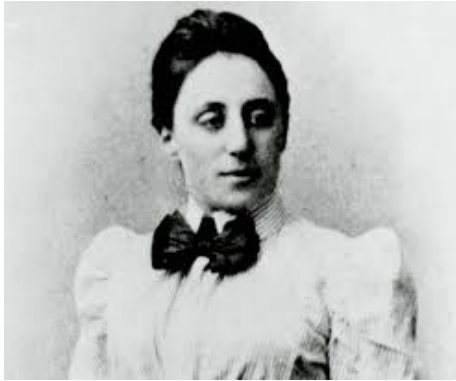
Figura 2: Emmy Noether ( 1882 (Erlangen) - 1935 (Bryn Mawr))

angolare possono essere elegantemente ottenuti rispettivamente a partire dalle proprietà di omogeneità dello spazio, del tempo e dall'isotropia dello spazio. Da questo punto di vista è come se