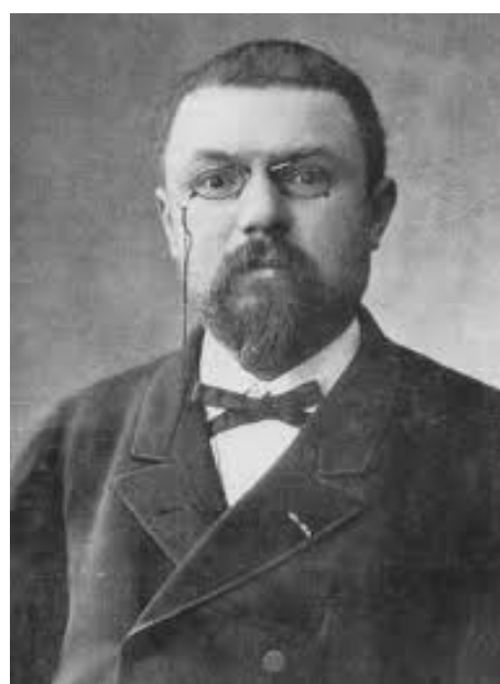
Figura 1: Henry Poincaré (1854 (Nancy) - 1912 (Paris))

secolo. Il problema dei tre corpi consiste nel risolvere le equazioni di Newton e di conseguenza le traiettorie di tre corpi che interagiscono tra loro, come ad esempio il sistema Sole-Terra-Luna. Nel 1889 il Re di Svezia fu addirittura indotto a bandire un ingente premio in denaro per chi vi si fosse applicato con successo. Tale premio fu riscosso da Poincaré, che provò come in generale non fosse possibile arrivare a una soluzione stabile. Lo scienziato francese mostrò in sostanza che esistono sistemi per i quali, scegliendo condizioni iniziali appena differenti, si possono ottenere traiettorie che possono divergere anche molto velocemente determinando appunto un'instabilità. Tutto ciò impedisce di dire qualcosa di definitivo