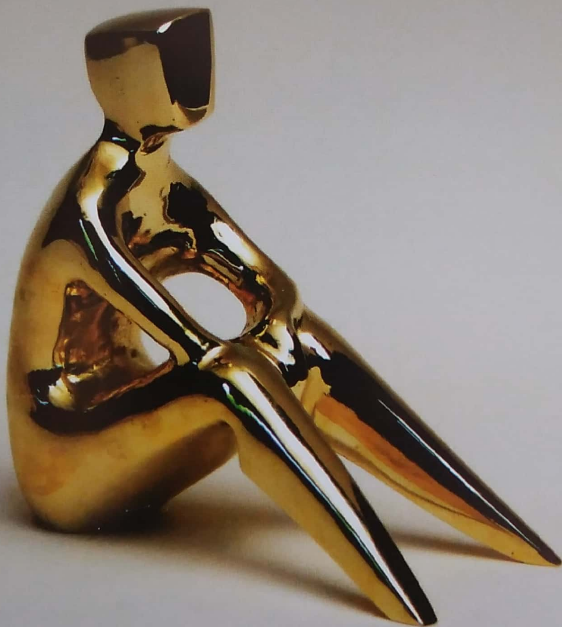
контемплација / contemplation 14 x15 x7 cm