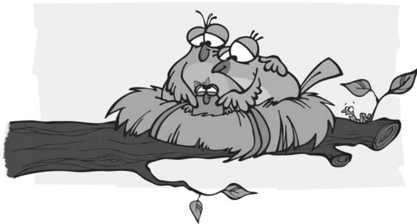
3. ábra. A madármeséhez készített illusztráció lányoknak

ja be, és korlátlan lehetősége van a mese befejezésére (Reynolds és Kamphaus, 2003). A történet befejezéséből pedig számos pszichológiai mechanizmusra, a madármese esetében például a szülők hozzáférhetőségére, indirekt módon pedig a hozzájuk való kötődés biztonságosságára is következtetni lehet (pl. az első mese esetében a fészekből a szülei mellől a földre leesett madárfióka odarepül-e valamelyik szülőhöz, akik a vihart követően más-más fára szálltak) (Mazzeschi, Lis, Calvo, Vallone és Superchi, 2001). A meseteszt eredetileg nem tartalmaz képet, de a könnyebb beleélhetőség kedvéért készítettünk fiúk és lányok részére kettő-kettő rajzképet a történethez (3. és 4. ábra).