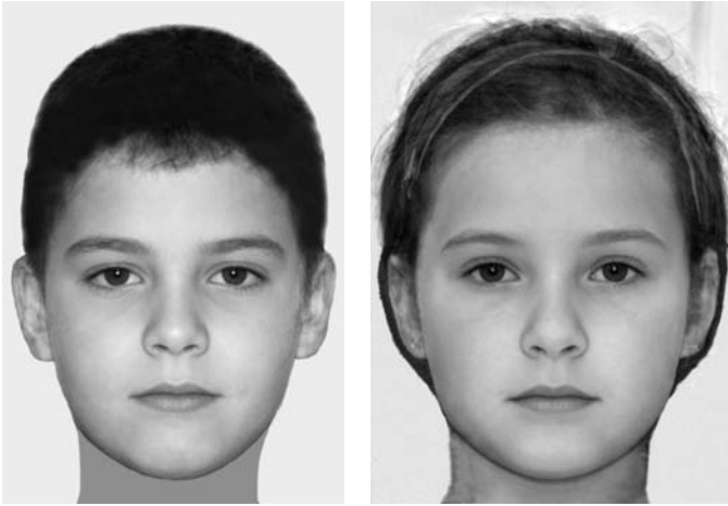
1. ábra. Alsó tagozatos átlagarcok