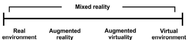
Figura 1: "virtuality continuum"

Paul Milgram & Fumino Kishino (1994) desenvolveram uma taxonomia baseada na Realidade Mista ("Mixed Reality") que designaram de "virtuality continuum" que envolve a fusão e complementaridade de ambiente real e do ambiente virtual (cf. figura 1).