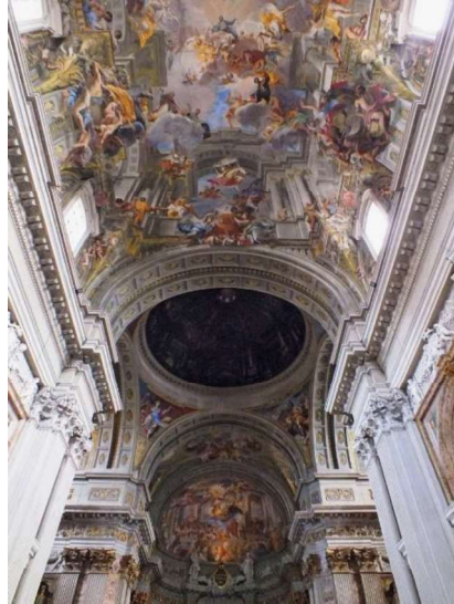
Figura 4: "Falsa cúpula – Igreja St. Inácio", Andrea Pozzo

O teto construído sobre uma superfície curva é observado, segundo indicação do próprio Pozzo, a partir de um disco de mármore no centro da nave que marca o ponto ideal a partir do qual o observador pode apreciar de forma plena a ilusão. Este é único porque, ao tratar-se de uma projeção geométrica, de qualquer outro ponto, os pilares e arcos pintados parecem torcidos e suspensos (Blakemore, 1986). A intenção de Pozzo foi, através de uma ilusão de ótica, abrir a superfície da abóbada de berço servindo-se de técnicas de projeção que faz com que um observador no chão veja uma enorme e luxuosa cúpula aberta para o céu brilhante e repleta de figuras flutuando para o alto.