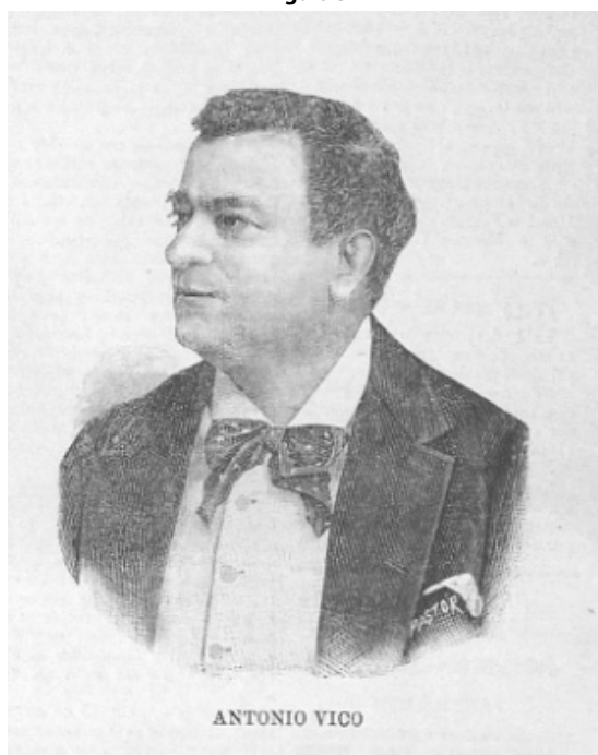
Diário Ilustrado. Viernes, 2 de septiembre de 1892.