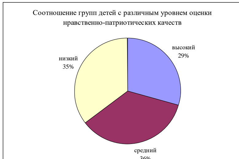
Рис. 3. Процентное соотношение групп детей

Опираясь на проведенный анализ оценки патриотической воспитанности у старших дошкольников, и на результаты, полученные на констатирующем этапе опытно-поисковой работы, был разработан комплекс занятий беседы об искусстве.