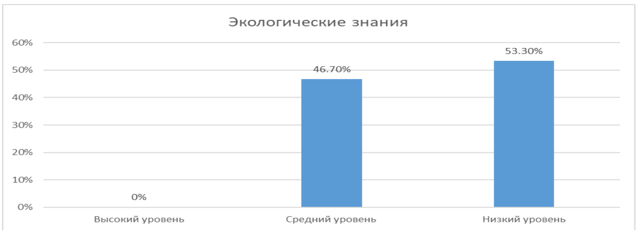
Рис. 2. Процентное распределение детей дошкольного возраста по уровню сформированности экологических знаний личности