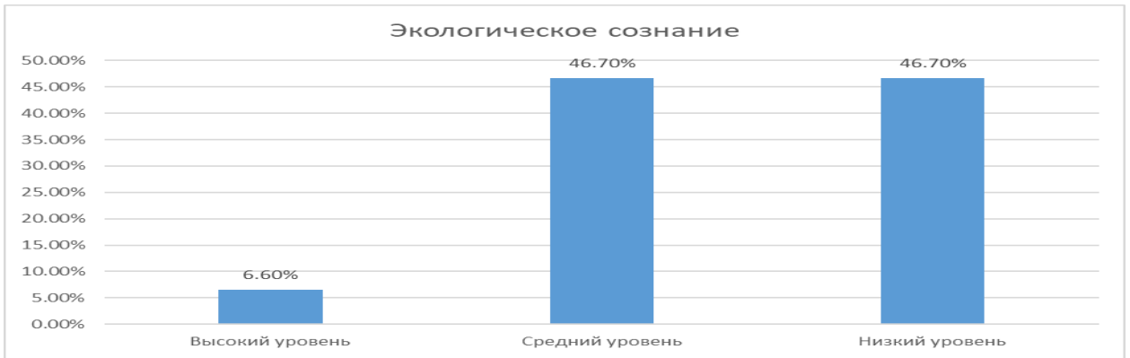
Рис. 1. Процентное распределение детей дошкольного возраста по уровню сформированности экологического сознания личности