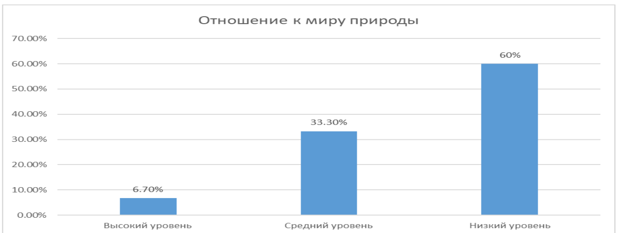
Рис. 3. Процентное распределение детей дошкольного возраста по уровню сформированности экологического сознания личности