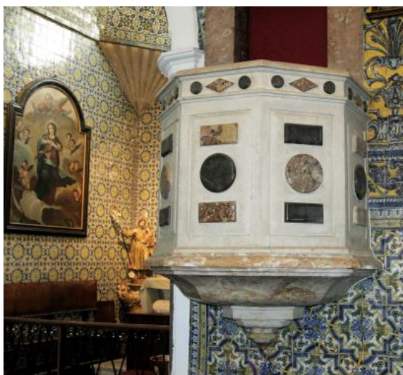
Figura 16. Igreja de São Mamede, púlpito em Lioz com ornamentos de Brecha da Arrábida e Calcário Negro de Mem Martins.