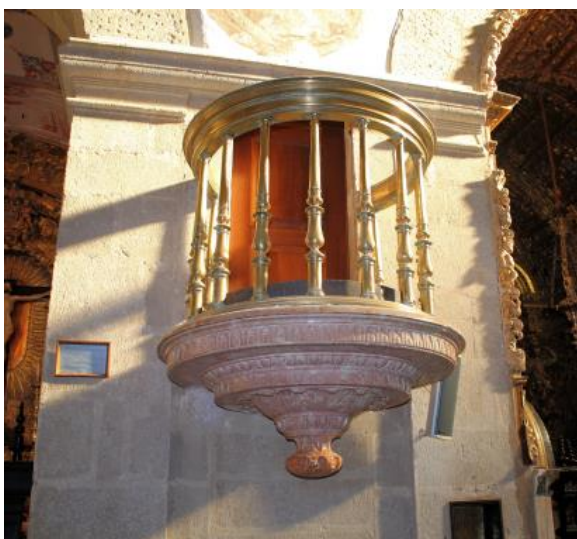
Figura 15. Igreja do Espírito Santo, púlpito com base em Lioz rosado ricamente trabalhado.