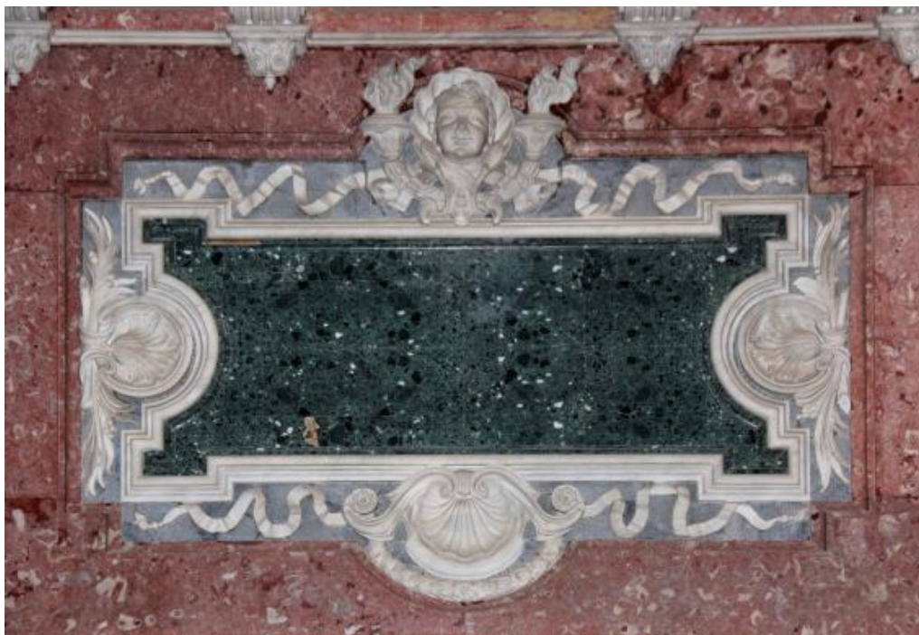
Figura 11. Painel ornamental sob o órgão no lado Noroeste do altar principal da Sé de Évora. Para além do “Verde Glaciale”, que se destaca ao centro, apresenta mármore branco de Estremoz, mármore azul claro de Trigaches e calcário Lioz Encarnadão de Pêro Pinheiro.