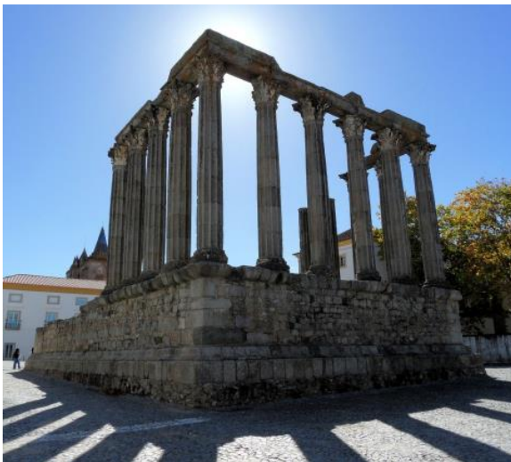
Figura 19. Templo Romano de Évora construído no Séc. I na então Liberatias Iulia é por si só um repositório das rochas da região. Os capitéis e bases das colunas são de mármore branco de Estremoz, as restantes rochas siliciosas provêm de pedreiras romanas nos arredores de Évora.

Em resumo, as pedras dos monumentos religiosos permitem reescrever a história da cidade numa perspetiva socioeconómica, histórica e arquitetónica que extravasa as fronteiras nacionais e não se esgota no emblemático Templo Romano (Figura 19).