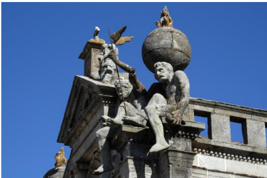
Figura 4. Pormenor das estátuas da Igreja dos Meninos da Graça onde se pode observar o avançado estado de meteorização em que as mesmas se encontram.