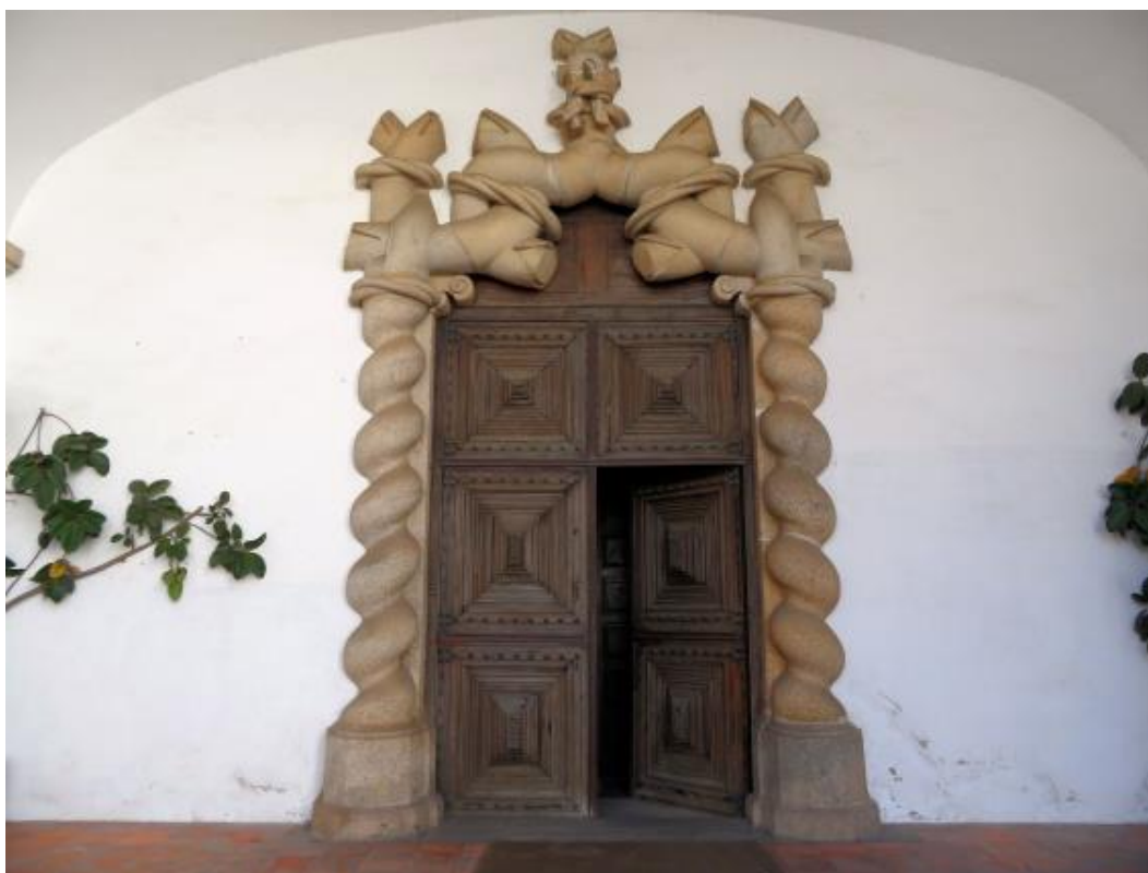
Figura 5. Portal de entrada da Igreja do Carmo, trabalhado em granito de Évora, que embora apresente alguns indícios de alteração denunciados pelos tons avermelhados, ainda assim revela um estado de conservação muito razoável. Esta fotografia foi tirada anteriormente ao restauro a que em 2013 o espaço da igreja foi sujeito.

cinzenta clara e podem apresentar encraves (manchas mais ou menos regulares de materiais, normalmente de cor mais escura do que a rocha que os envolve). Estes encraves são facilmente identificáveis e em alguns casos, em função das características petrográficas que apresentam (textura, dimensão do grão e minerais presentes, etc.) é mesmo possível determinar aproximadamente o local de exploração da rocha que os contém no terreno. Os fenómenos meteóricos de alteração destas rochas conduzem a que as mesmas adquiram tonalidades cremes ou castanhas. À superfície os minerais primários (quartzo, feldspatos potássicos e sódico-cálcicos, micas (branca ou moscovite e negra ou biotite), anfíbulas, entre outros, ditos acessórios) alteram-se e esta “degradação” da rocha não é mais do que uma adaptação dos seus constituintes às condições a que agora estão sujeitas (Figura 7). É um reflexo do tempo que passou por elas desde que foram retiradas dos afloramentos a que correspondem. Esta característica transforma-as em património do “Tempo” e constitui um fator intangível que enriquece a Cidade e contribui para a sua identidade.