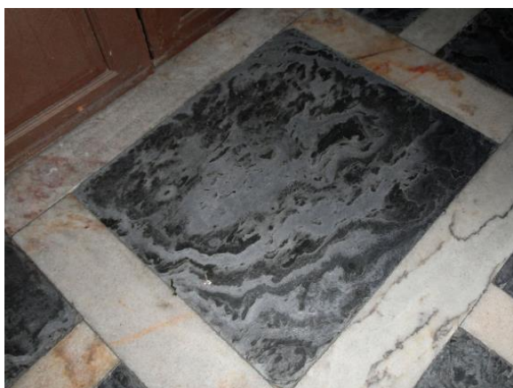
Figura 13. Igreja do Carmo. Pavimento revestido com xisto luzente e mármore indiferenciados.

Os xistos também são rochas metamórficas. Mais ou menos siliciosos, esverdeados, acinzentados ou “borra de vinho”, são essencialmente utilizados nos pavimentos em conjunto com mármore de várias tonalidades definindo padrões e jogos de cor geometricamente disposto nos espaços que preenchem (Figura 13). Ocasionalmente, como acontece na igreja de São Mamede, foram utilizadas placas de grandes dimensões painéis colocados nas paredes (Figura 14).