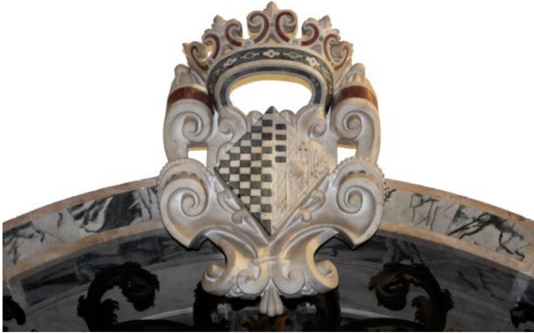
Figura 9. Ornamento em forma de coroa na Igreja do Espírito Santo. Os tons claros correspondem a mármore cremes de brancos de Estremoz o azul ao Ruivina e a cor avermelhada ao Lioz Encarnadão.

Neste grupo podemos ainda incluir, por também serem metamórficas e de menor dureza que as rochas siliciosas, os serpentinitos que são rochas verdes, com aspecto brechóide e são facilmente detetáveis por apresentarem uma cor de fundo verde-seco muito característica. Onde quer que tenham sido utilizadas contrastam com as que lhes sejam adjacentes. Podem-se encontrar no altar principal da Sé de Évora, na Igreja do Convento do Espinheiro e na Igreja do Espírito Santo, por exemplo.