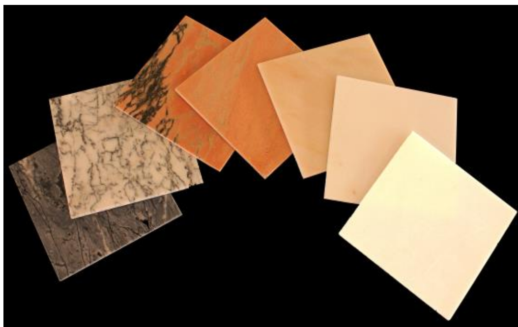
Figura 8. Algumas das variedades de mármore em ladrilhos quadrados com 30 cm de lado. Da esquerda para a direita: Ruivina da Lagoa, Pele de Tigre de Pardais, Rosa Vergado de Borba, Rosa Aurora, Creme de Pardais, Branco Rosado de Estremoz e Branco Vigária.