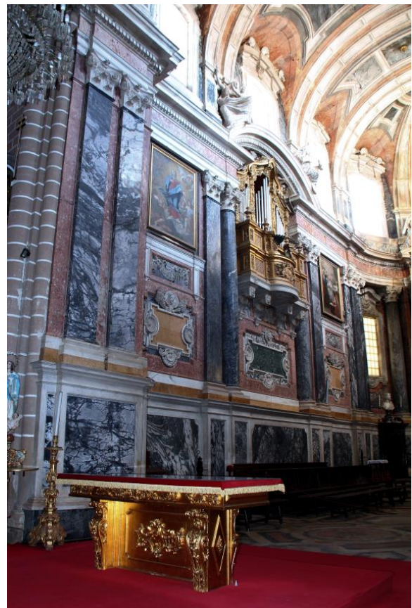
Figura 10. Vista geral do lado poente do altar da Sé Catedral de Évora (Igreja de Santa Maria). Destacam-se as colunas, placas retangulares verticais e os painéis inferiores (com dobras) em mármore ruivina escuro e vergado; dois painéis em amarelo de negrais e o painel mais trabalhado e com a brecha verde, sob o órgão. Rodeando todas as estruturas referidas está o Lioz, variedade Encarnadão. Os capitéis ricamente trabalhados são em mármore branco e creme de Estremoz.

Em relação à rocha verde, percebe-se que foi usada a técnica de polimento em livro aberto e desdobrado. Esta consiste em polir ambas as faces resultantes de um corte e aplica-las lado a lado, vertical e/ou horizontalmente. Desdobrado porque é perceptível que o processo foi repetido várias vezes o que tornou possível que um fragmento relativamente pequeno possa ter originado placas suficientes para cobrir as áreas necessárias do painel. O detalhe também mostra que pequenos fragmentos foram de igual modo utilizados (Figura 12), facto só por si revelador da preciosidade, por escassez, com que esta rocha era considerada.