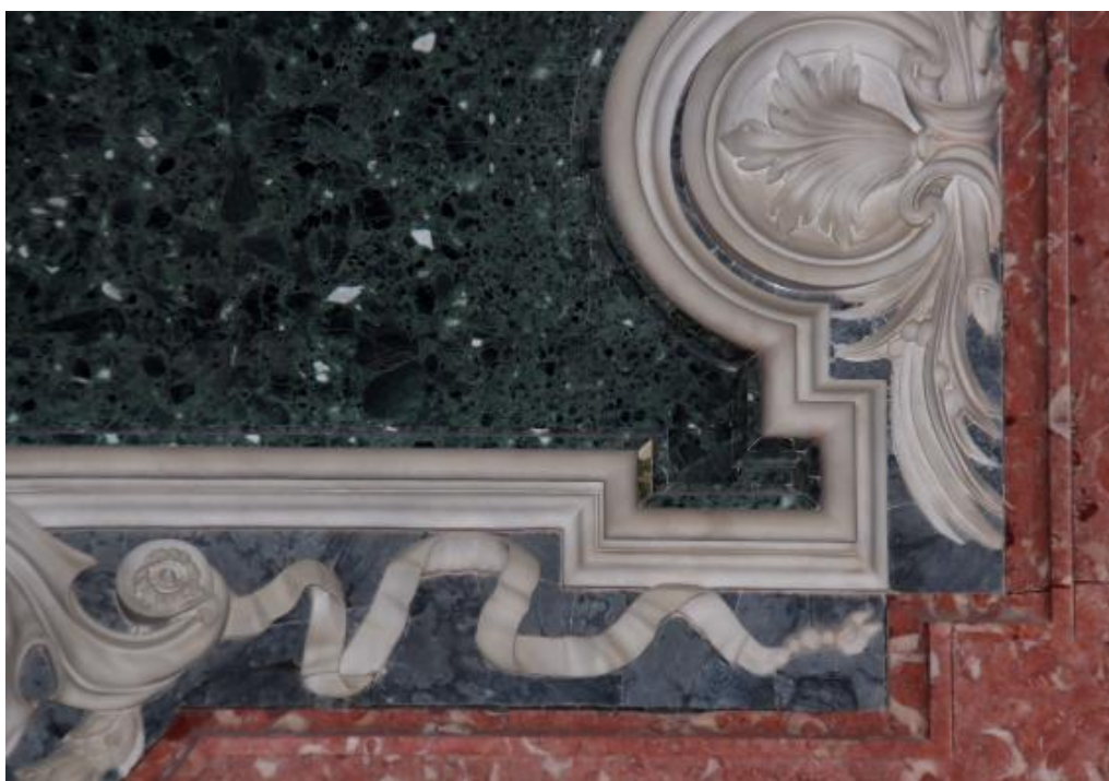
Figura 12. Pormenor do painel ornamental sob o órgão no lado direito (Sudeste) do altar principal da Sé de Évora. Aqui o mármore azul de Trigaches utilizado no outro painel é substituído por mármore Ruivina Claro de Estremoz. No Lioz destacam-se os fósseis brancos, lamelibrânquios (rudistas) muito característicos de todas as variedades cromáticas de Lioz.

Materiais similares a estes só foram explorados em Portugal no Séc. XX, mais intensamente entre os anos 60 e 80, na localidade de Donai, distrito de Bragança. A utilização destas rochas verdes em edifícios tão antigos, mesmo sem uma análise muito detalhada permite colocar a hipótese de que se trata de materiais importados muito provavelmente de Itália, onde no Norte ainda hoje se exploram, sob o