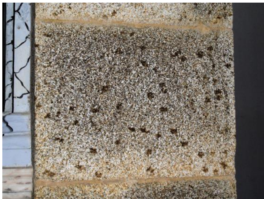
Figura 7. Detalhe da alteração dos cristais de biotite no granito cinzento utilizado na Igreja de Nossa Senhora da Pobreza.