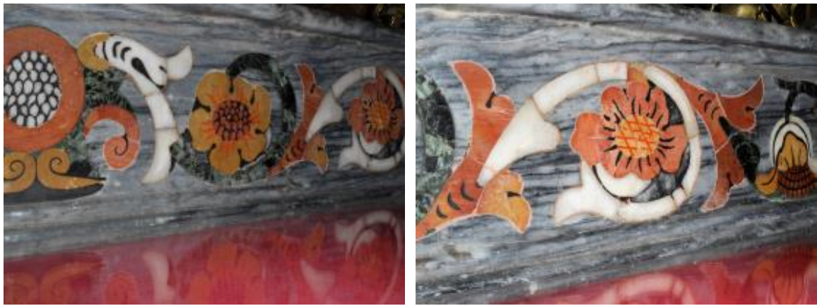
Figura 18. Friso na Igreja do Espírito Santo. Composto por serpentinito, mármore branco de Estremoz, calcários Amarelo Negrais, Negro de Mem Martins e Lioz Encarnadão num fundo de mármore Ruivina de Estremoz.