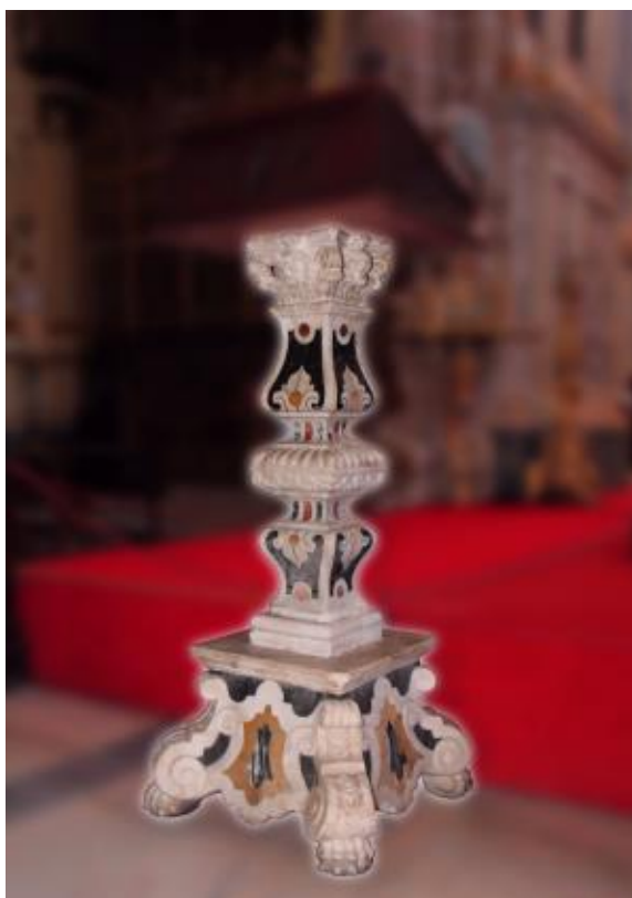
Figura 17. Sé de Évora, púlpito composto por mármore branco e ruína de Estremoz e calcários Amarelo de Negrais, Mem Martins e Lioz Encarnadão.

Erroneamente aplicados, por vezes encontram-se nos monumentos outras variedades de calcários tais como Alpinina, Vidraço, Ataíja, Moca Creme ou Moleanos, geralmente em obras de restauro ou ampliação mais recentes. Estes provêm do Maciço Calcário Estremenho e correspondem a unidades geológicas jurássicas distintas dos calcários da região de Lisboa que são cretácicas.