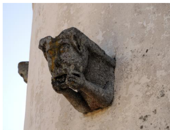
Figura 3. Gárgula em granito na Igreja de São Brás.

arcos, estátuas, etc.). Entre as obras mais emblemáticas destacamos as gárgulas na Igreja/Ermida de São Brás que ao contrário dos restantes monumentos religiosos a Igreja de São Brás não apresenta externamente grandes estruturas em pedra (Figura 3), as estátuas na Igreja da Graça (Figura 4) e os robustos ornamentos da porta dos nós (Igreja do Carmo, Figura 5), atribuída a Diogo de Arruda (Espanca, 1950). Acontece que, expostas aos agentes atmosféricos, com o decorrer dos anos, estas rochas sofrem os efeitos da meteorização, bem patentes nos exemplos apresentados, com a exceção da Igreja do Carmo onde o estado de conservação é excelente em virtude, cremos nós, do resguardo em que se encontra inserido (Figura 5).