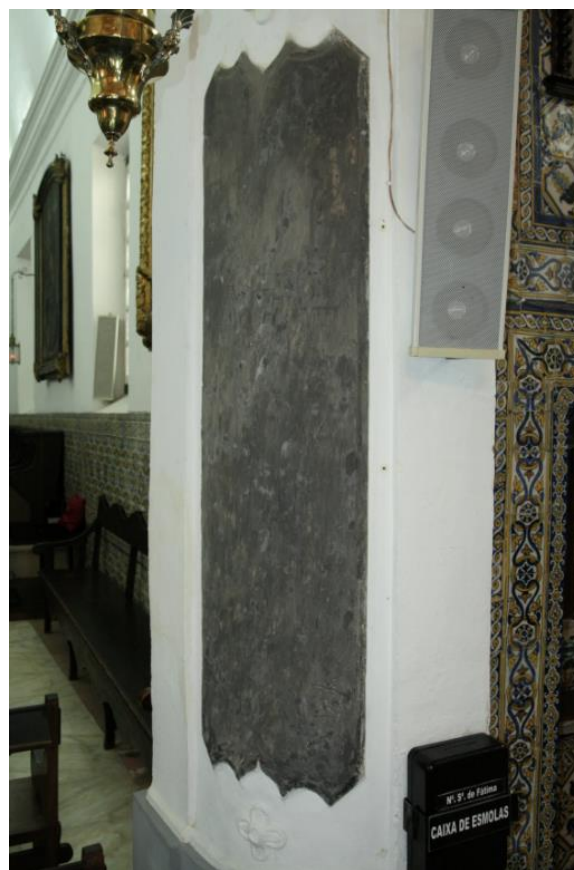
Figura 14. Igreja de São Mamede, painel em xisto. No Alentejo, placas de xisto de tão grandes dimensões são raras e a utilização nestes painéis é um reconhecimento dessa raridade. Na atualidade os ladrilhos de maiores dimensões são vendidos a um preço muito superior aos de menores dimensões, deste modo o tamanho das peças aplicadas surge como um indicador do poder económico do proprietário.

edificação do Convento de Mafra e à Reconstrução Pombalina de Lisboa.