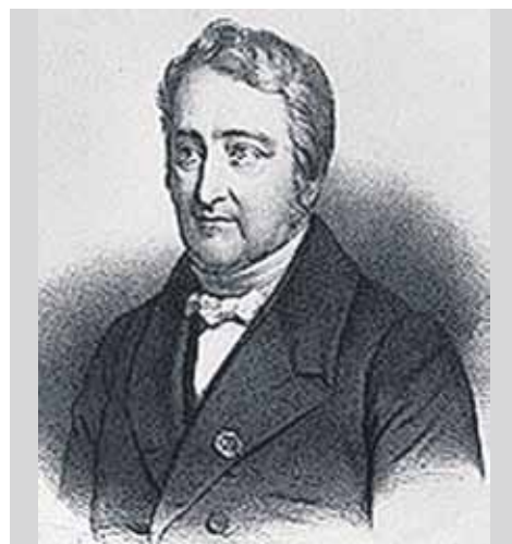
Pierre-Joseph Pelletier (1788-1842)