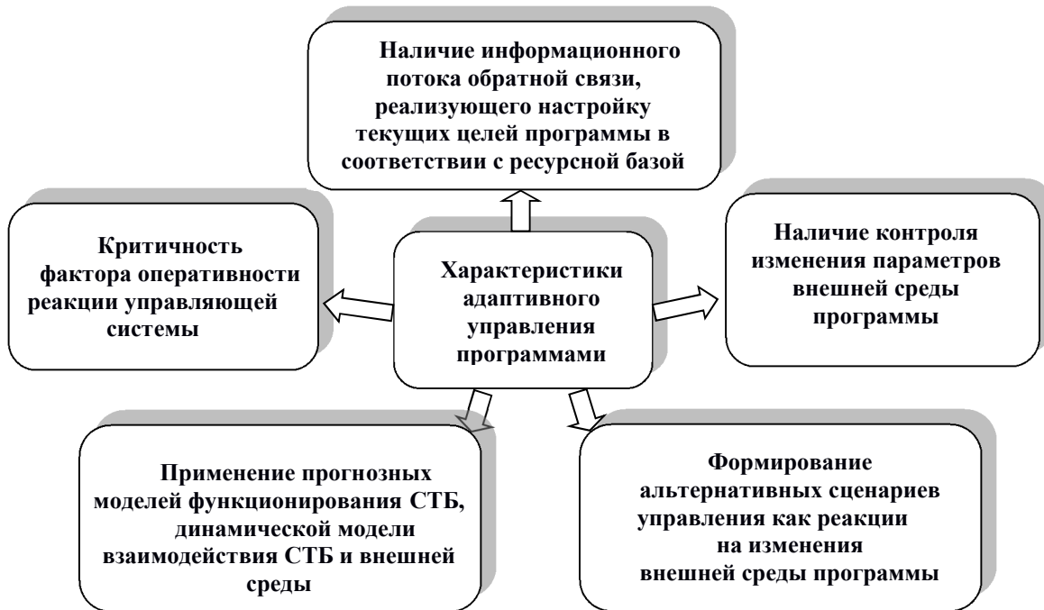
Рисунок 1 – Характеристики адаптивного управления программой

– при проведении работ по программам необходимо учитывать возможную нерегулярность поступления и вероятность внезапного прекращения бюджетного финансирования.