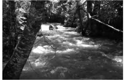
Ilustración 4. Río Grande.