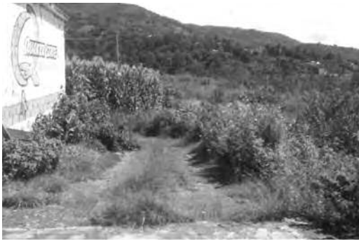
Ilustración 7. Acceso al terreno.

El polígono del terreno no está contemplado en el área urbana actual que señala el Plan Municipal de Desarrollo Urbano. El uso de suelo que le corresponde al sitio donde se planea crear el Parque Ecoturístico es: AG-BP-TM (Agropecuario de baja productividad por temporal). El Plan Municipal de Desarrollo Urbano de Almoloya de Alquisiras, así como cualquier otra normatividad, no establecen criterios que impidan el aprovechamiento de esta zona con fines ecológicos. El predio está ubicado a un costado de la carretera La Puerta-Almoloya de Alquisiras, en la Colonia Cuarta Manzana. Dicha carretera cuenta con dos carriles (uno por sentido). El ancho promedio de esta vía es de 8 a 9 m. Esta carretera es la única forma de acceder al predio, pues el terreno se encuentra en una cañada (imagen 6). La accesibilidad al predio en la actualidad sólo se puede realizar caminando en un trayecto de aproximadamente 80 m. Debido a que no se ha realizado por el momento la apertura de una calle (Ilustración 7).