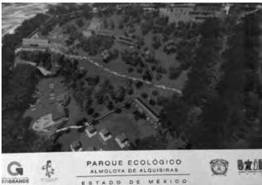
Ilustración 10. Planta de conjunto.

rrenciales, granizadas y heladas ocasionales. Los vientos son moderados y van de noreste a sureste.