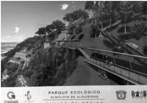
Ilustración 13. Andadores y plataformas.