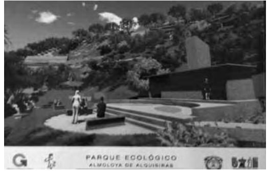
Ilustración 12. Áreas para días de campo y campismo.