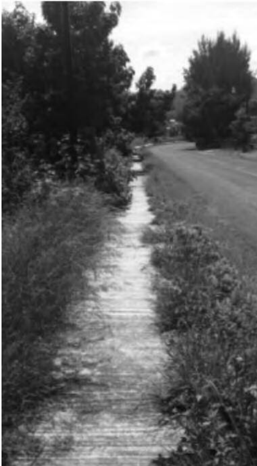
Ilustración 6. Espacio peatonal a pie de carretera.