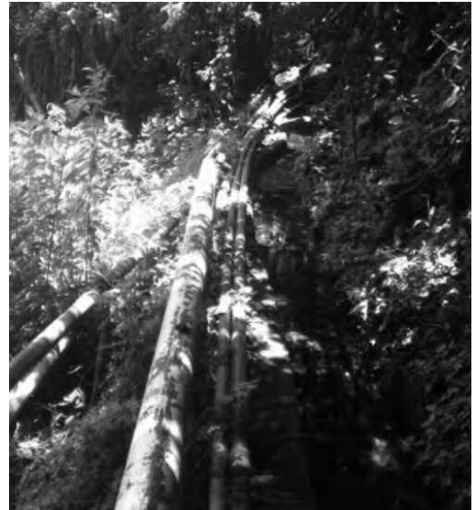
Ilustración 5. Canal de Riego.