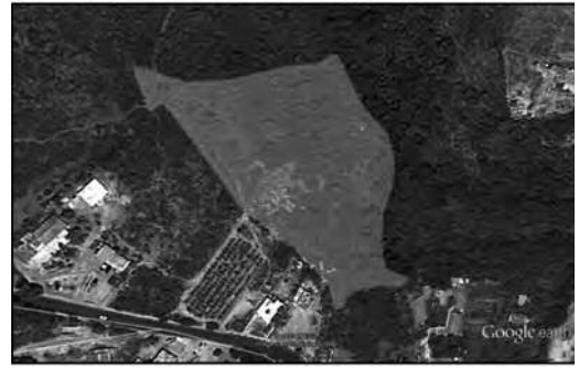
Ilustración 3. Polígono del predio.

El terreno es rocoso en su mayoría y se presenta en una sola ladera que va de oeste a este, el cual es el punto más bajo. La pendiente va de 21 a 64 grados, variando entre estas medidas a lo largo y ancho del terreno. El paso del agua ha modelado el paisaje dejando como vestigio esta micro cuenca, dando como resultado una variación en la altura, lo que favorece el clima del lugar y propicia el ambiente idóneo para la alta variedad de vegetación. En la parte más baja del terreno cruza el Río Grande (Ilustración 4), y en el interior del predio atraviesa un canal de riego (Ilustración 5).