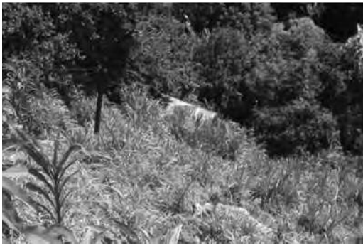
Ilustración 8. Vegetación en el terreno.