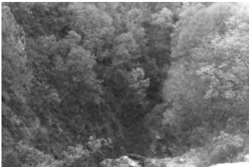
Ilustración 9. Topografía del terreno.