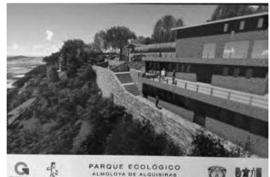
Ilustración 14. Administración, talleres y baños.

14). Cubiertas de madera y teja. Escaleras y muros de contención en piedra braza. Reja perimetral de material reciclado (PEPE), dadas las características de la pendiente del terreno, es necesario hacerlo con tramos de zapatas corridas ligadas a muros de concreto, ya que una guarnición de desplante resulta insuficiente para anclar la reja al terreno. Los miradores y plataformas de madera (Ilustración 16). La iluminación general de las áreas exteriores es con luminarios solares. El calentamiento del agua para regaderas de la zona de campismo es con paneles solares y se complementa con regaderas eléctricas. La descarga de aguas negras se