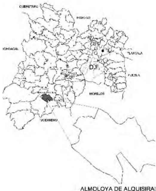
Ilustración 1. Localización estatal.