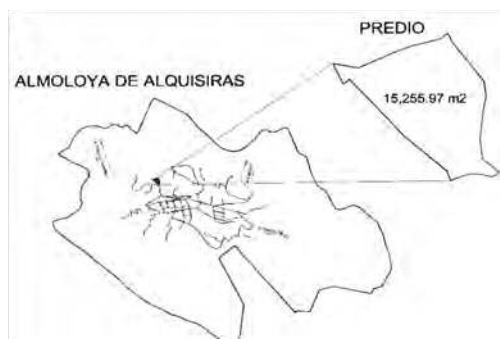
Ilustración 2. Localización municipal.