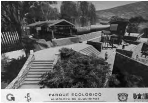
Ilustración 11. Acceso y juegos infantiles.