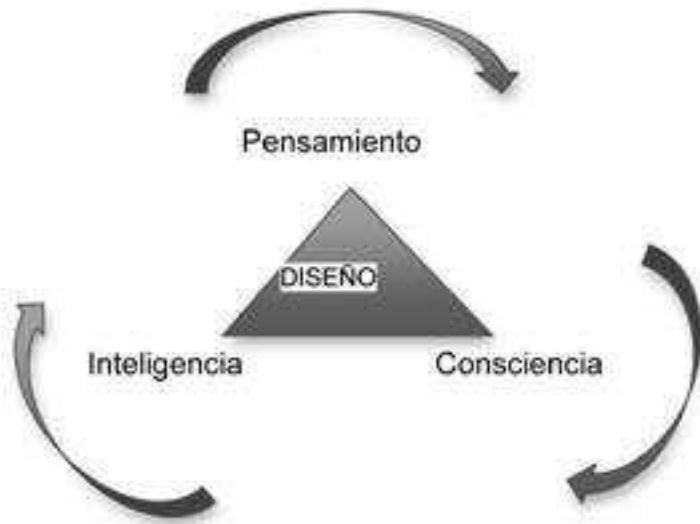
Imagen 1. Pensamiento y consciencia en el Diseño.

En este sentido, la responsabilidad ética de los arquitectos en nuestro quehacer, como diseñadores de escenarios habitables constituyentes de la ciudad, exige la necesidad de recuperar la capacidad de observar las formas de habitar los espacios, percibirlos desde distintas perspectivas para estar en posibilidad de generar aproximaciones en la construcción de conocimiento -diseño- coherente con la realidad. De este modo, conocer e investigar el diseño hoy requiere un bagaje teórico y metodológico adecuado al grado de complejidad que el contexto actual requiere, pues hablar de diseño resulta incluir a la ciencia, el arte, la técnica y, en los últimos años, a la tecnología. Esta última, que en el modelo de globalización del que hoy somos parte, es parte fundamental en el quehacer del diseñador. Lo anterior, sugiere pensar y recorrer la historia del diseño, la incorporación y vínculo estrecho entre ciencias como la biología, psicología, física y ecología, en el terreno de la arquitectura y el urbanismo. Si pensamos en la casa, la ciudad y el territorio como organismo vivo, será posible ubicar relaciones multiescalares entre redes y tejidos que constituyen la organización y estructura compleja del espacio habitado. En este contexto, es preciso inventar otros instrumentos conceptuales y crear nuevas herramientas que nos permitan navegar territorios móviles y espacios multidimensionales. Donde el espacio-tiempo se integre en la construcción de lugares para vivir.