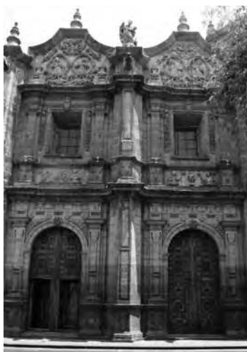
Imagen 5. Puertas "gemelas" del Ex-convento de Santa Rosa María, Morelia, Mich.

Siempre que se habla de varias de estas ciudades, es inevitable relacionarlas con sus fundaciones monásticas -tanto de frailes como de monjas-, algunas han logrado conservar estos inmuebles de tal manera que ahora son consideradas como ciudades coloniales y patrimonio de la humanidad por la categorización que hizo la UNESCO, como es el caso de Querétaro, urbe con investigaciones notables sobre la importante contribución de los conventos novohispanos a su traza y paisaje actual. Esta ciudad también es de los pocos casos de los que se ha documentado la evolución urbanística de las metrópolis novohispanas, que recibió parte de su traza y actual paisaje debidos a la presencia de sus conventos femeninos.