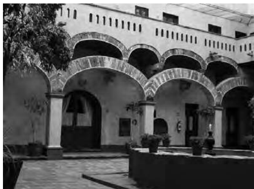
Imagen 3. Ex-convento de la Purísima Concepción, Puebla, Puebla.

Por su parte, la socióloga Marcela Lagarde (2003) sostiene que el atávico encierro de la mujeres va relacionado directamente con el ejercicio del poder del varón o androcentrismo de la estructura social, el que, bajo esquemas de dominación tradicionales, ha confinado a la mujer a dichos espacios. No se debe olvidar las herencias de las grandes haciendas y mayorazgos que fueron reservadas para primogénitos o hijos varones. Así, en el enclaustramiento la mujer desarrolla labores de curación, de cocina, educación, entre otros, que distan mucho de otras actividades como las académicas, políticas e intelectuales vinculadas al espacio externo o público de los varones.