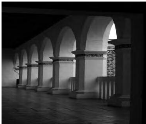
Imagen 1. Claustro del Ex-convento de Santa Mónica, Puebla, Puebla.

cerrados asociados con las mujeres, entre otros fundamentos teóricos o de ciertos componentes del feminismo y bajo consideraciones muy específicas de la violencia simbólica y otros aspectos de este tipo de desigualdad social.