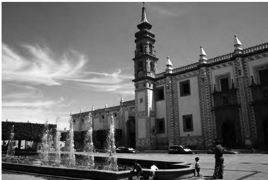
Imagen 6. Ex-convento de Santa Rosa de Viterbo, Querétaro, Qro.

solares, terrenos 8 , así como mercedes de agua, activando con estos movimientos la morfología y diseño urbano tanto fuera como dentro de los conventos.