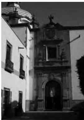
Imagen 4. Una de las puertas "gemelas" del Ex-convento de Santa Clara, Querétaro, Qro.

visuales y espacios con funciones muy específicas. Así, San Jerónimo, a quien se le atribuye la imposición de ciertas condiciones para originar el encierro, indica que las mujeres deberían llevar una vida completamente ascética. Proponía que los padres ofrecieran a sus hijas vírgenes y a concentrarlas en el monasterio donde no viesen otra cosa que las desviara de la virtud.