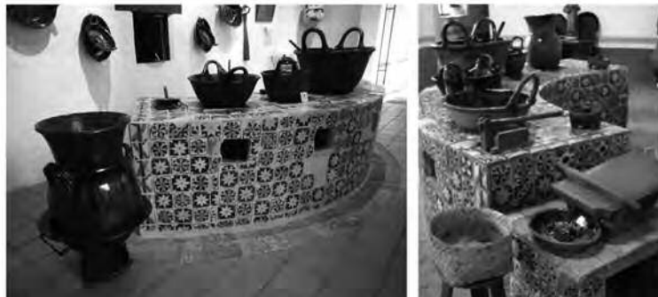
Imagen 2. Cocina del Ex-convento de Santa Mónica, Puebla, Puebla.

Entre ellas, se puedan citar las simbolizaciones de los roles sociales y aquellas formas de pensamiento religioso y de espiritualidad que, entre otras predeterminaciones y expresiones de la religiosidad imperante, ponderaban el encierro, el castigo corporal y la penitencia, así como el pensamiento de la época y los innumerables sacrificios de las monjas al “renunciar al mundo”. Entre ellos se cuentan las penitencias y algunos otros roles de las religiosas de esos tiempos y diversos elementos como su arquitectura particular y el impacto en el urbanismo local, la negación del mundo terrenal para las “esposas y siervas de Dios”, todos ellos tienen puntualmente respuestas para cada espacio y diferentes obras de arte dentro de los conventos femeninos.