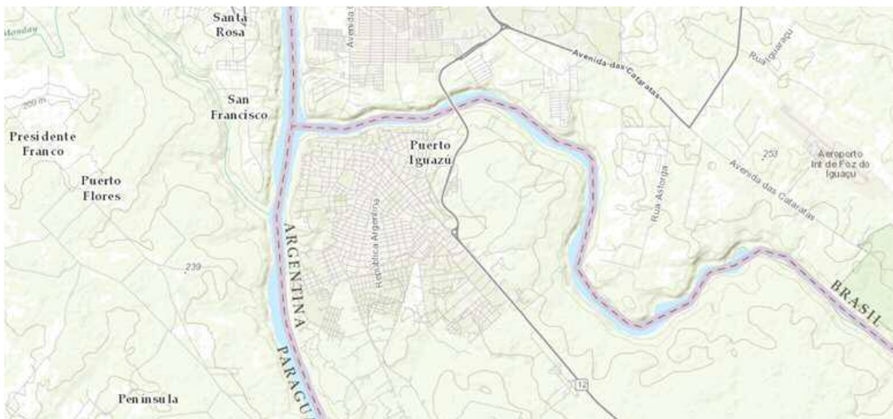
Tabla 1 Plano Topográfico de Puerto Iguazú

La ciudad turística de Puerto Iguazú, ubicada en noroeste de la Provincia de Misiones en la República Argentina, se encuentra en un área limítrofe con la República Federativa del Brasil y la República del Paraguay. Es un territorio transfronterizo y global caracterizado por la interacción de los flujos de bienes, de imágenes, de personas y de capital global.