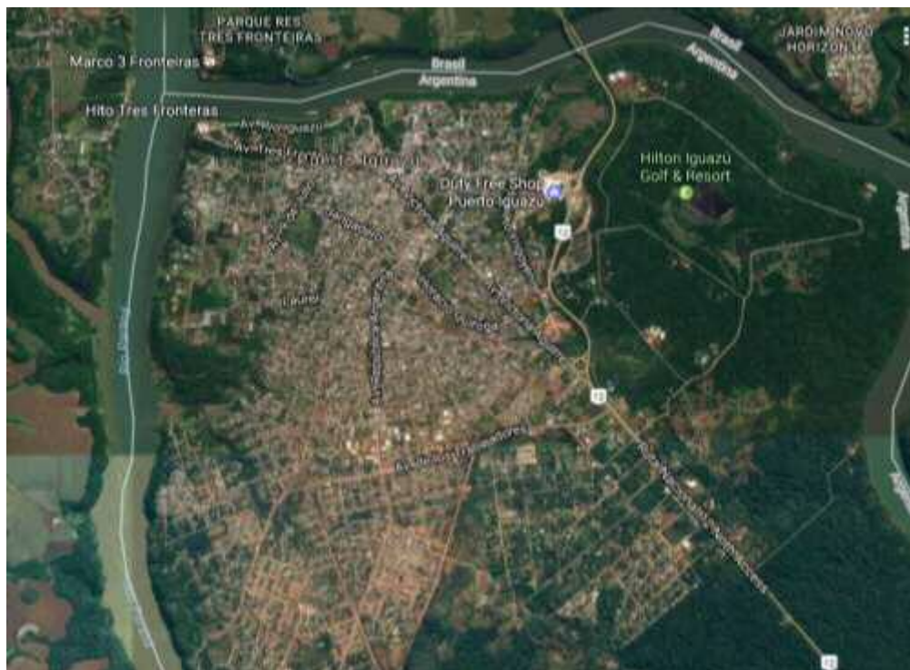
Tabla 3 Puerto Iguazú

Diversos trabajos de planificación detallan las dificultades de ordenamiento territorial y de déficit de infraestructura urbana. Sin embargo, la problemática sigue vigente y se agudiza con el contexto “Puerto Iguazú careció históricamente de una adecuada planificación, su trazado es caótico y tiene grandes falencias en los servicios básicos de agua y electricidad, no cuenta con sistema cloacal y los arroyos que atraviesan el ejido municipal están altamente contaminados” (Gandolla, 1995 en Núñez, 2009: 3).