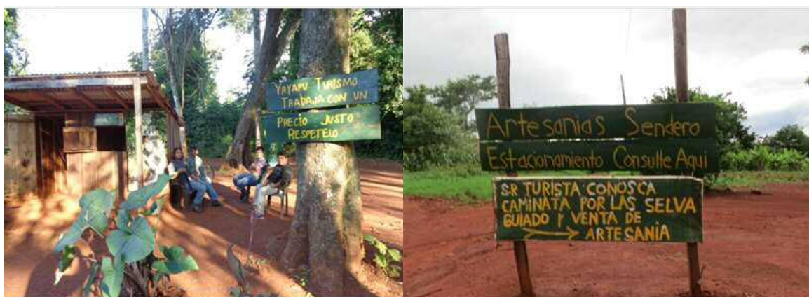
Imagen 2 Proyectos turísticos locales 3