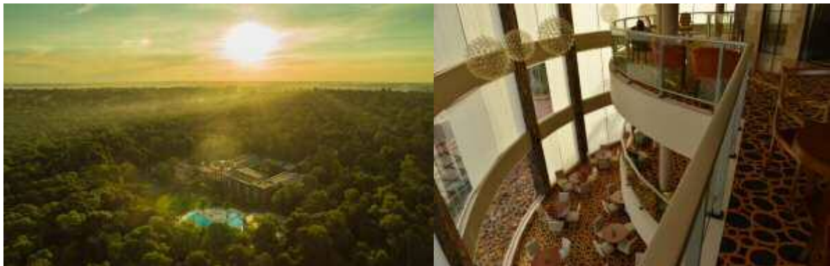
Imagen 1 Falls Iguazú Hotel & Spa 2