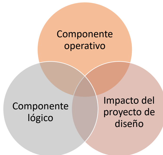
Figura 5. Modelo de programa por componentes

resultados propuestos desde la primera idea, incluido en el plan y programa detallado para esta fase (Figura 5).