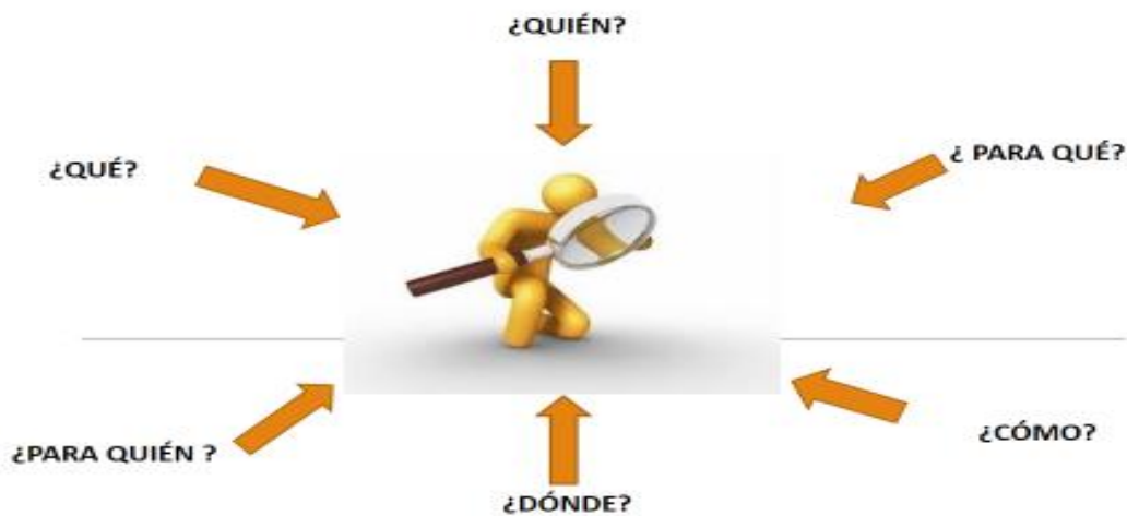
Figura 1. Preguntas y respuestas para el diseño de proyectos

Cuando una entidad gestiona su actuación a través de proyectos busca obtener el conocimiento preciso de la realidad, el conocimiento de los objetivos a conseguir, el control de los cambios en los objetivos, el conocimiento del camino y del coste y el plazo de ejecución, sin duda el saber actuar