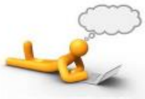
Figura 2. Planeación en la investigación.