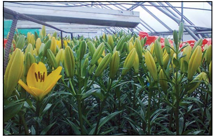
Figura 2. Se estudia la influencia del Mg y el Zn en características de Lilium .

La aplicación de 10 ml/maceta/20 días de solución Steiner (1961) aumentada 40 veces para generar una dosis de N de 53 mg N/maceta/20 días generó mayor altura de tallo en Lilium 'Acapulco', en comparación con una dosis de 20 ml/maceta/10 días. No existió diferencia en el índice de verdor de