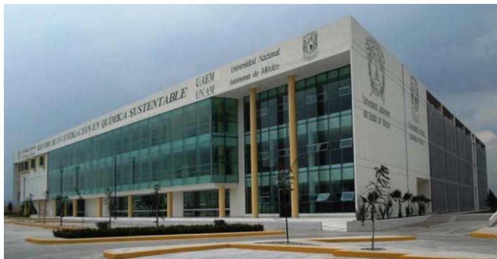
FIGURA 1. Fachada del CCIQS, UAEM-UNAM.