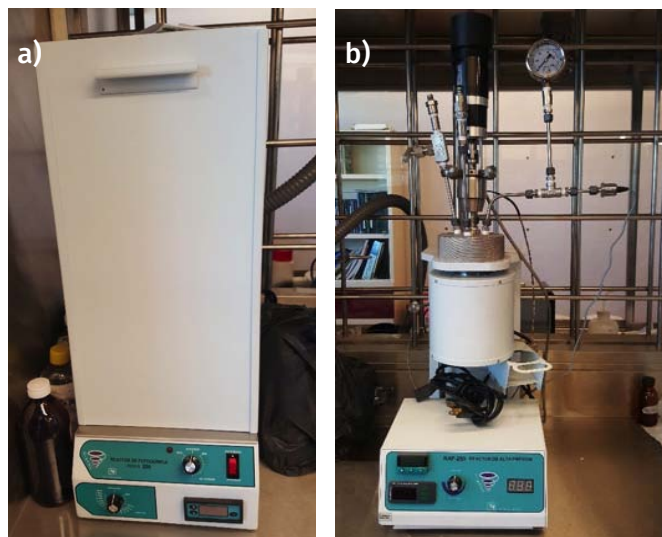
FIGURA 5. a) Reactor de fotoquímica con lámpara UV; b) reactor de alta presión marca Prendo.