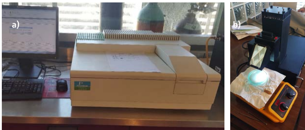
FIGURA 4. a) Espectrofotómetro Lambda 35 de Perkin Elmer; b) simulador solar Science Tech.

pectrofotómetro UV-vis lambda 35 de Perkin Elmer (figura 4a), un simulador solar marca Science Tech (figura 4b), un reactor de fotoquímica Q-200 Marca Prendo (figura 5a), autoclave (figura 5b), microscopio óptico digital, así como lámparas ultravioleta, rotavapor (figura 6 a), horno para calcinar (figura 6 b), equipo Soxleth, pHmetro, turbidímetro, microcentrífuga, equipo de fisisorción CHEMBET 3000 y un equipo de depósito por giro (figura 7b), entre otro instrumental y equipo de laboratorio menor que le han servido de apoyo para dar seguimiento al desempeño de las formulaciones catalíticas preparadas.