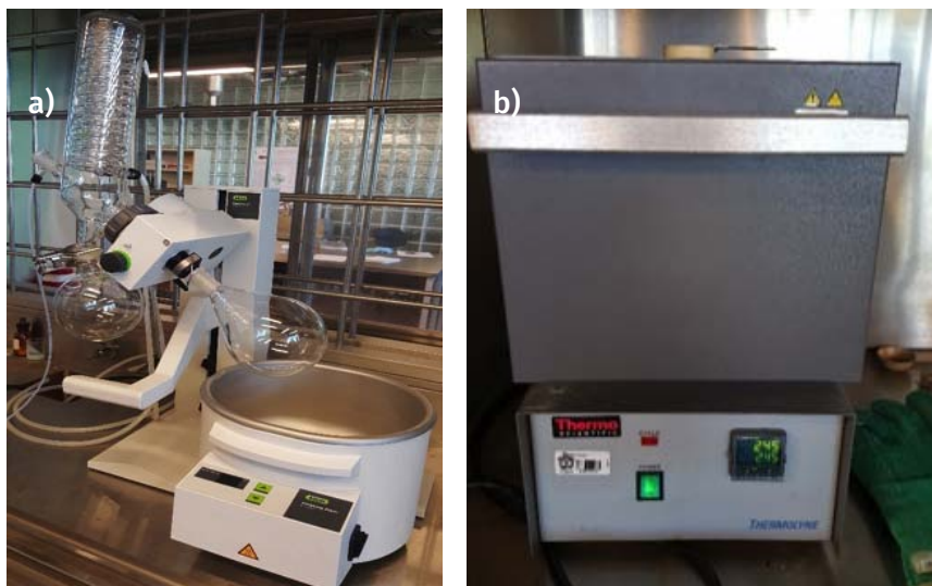
FIGURA 6. a) Rotavapor, Equipar; b) horno de convección de aire, Thermoline.