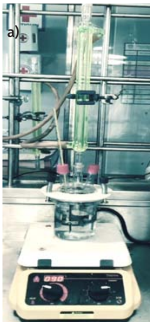
FIGURA 3. a) Reactor STR con condensador para la producción de biodiesel mediante la transesterificación de aceites vegetales catalizada heterogéneamente; b) fotorreactor STR para la evaluación catalítica de fotocatalizadores.