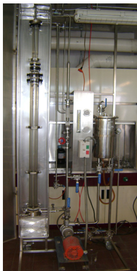
FIGURA 2. Columna de burbujeo: reactor fotocatalítico y/o electroquímico.