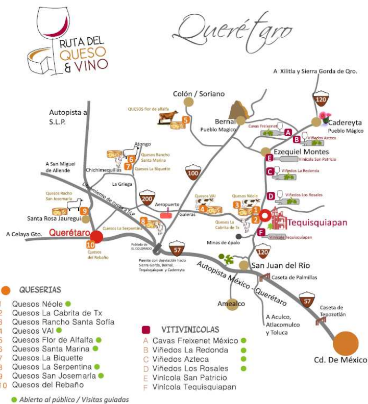
Figura 2. Representación gráfica de la Ruta del Queso y el Vino.