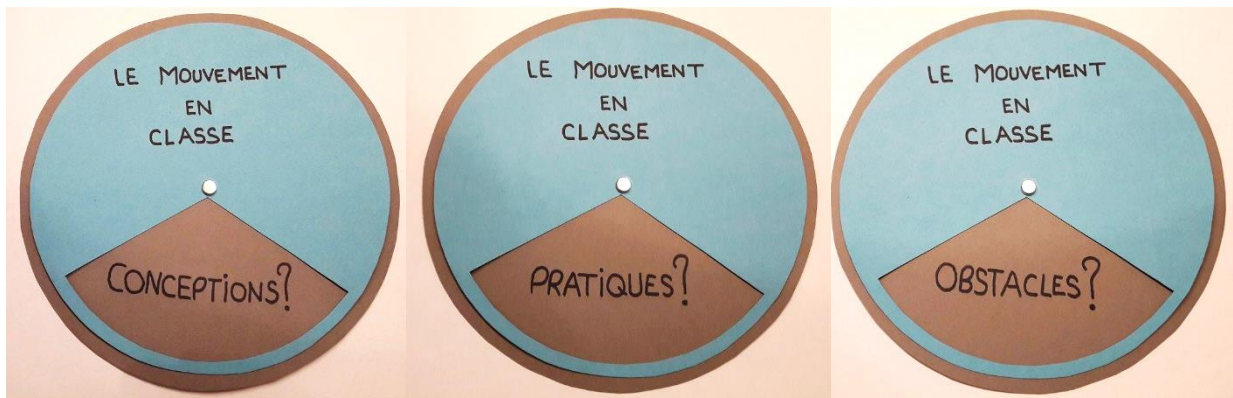
Figure 3 – Support visuel lors des entretiens