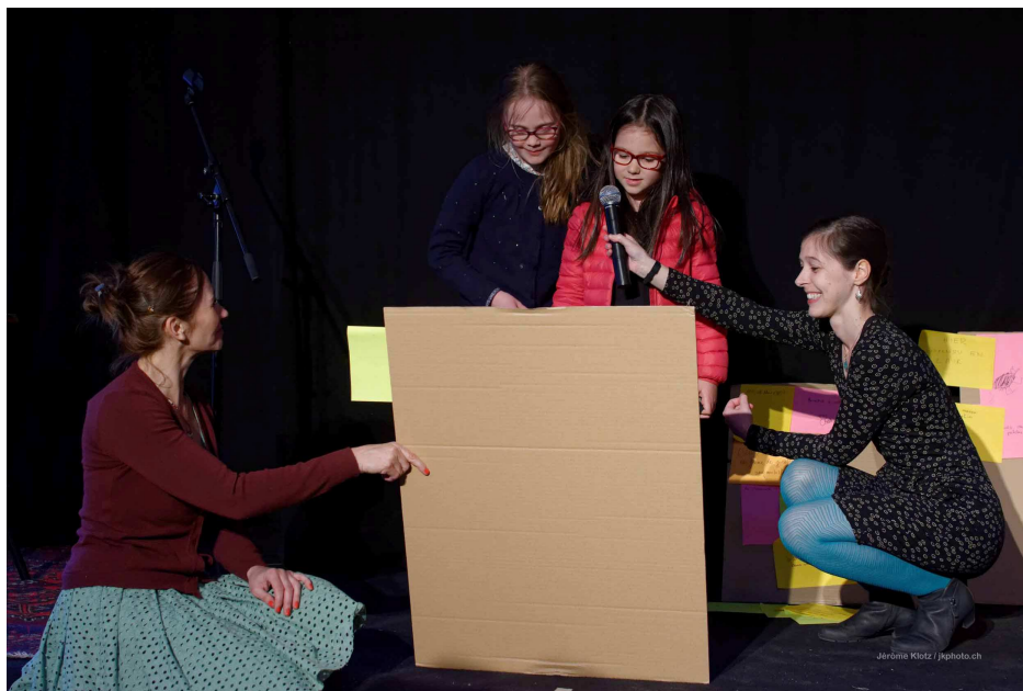
Atelier avec le public à la fin de la performance A portée de rêve à la Nuit de la lecture le 29 avril 2017, Lausanne