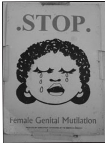
FIGURA 2 STOP MGF. CAMPAÑA EN GAMBIA

jas de información a pacientes y usuarios que aborden el tema (Figura 2). Es importante iniciar el abordaje sin la presión del tiempo o de la necesidad de una intervención inmediata. Debemos ser conscientes que para las mujeres africanas renunciar a prácticas como la MGF es vivido como un choque entre su identidad tradicional y unos valores que se les imponen desde fuera. Es una experiencia de transgresión y ruptura con lo preestablecido en su cultura. Es un proceso de cambio lento, y acompañado, para la construcción de una identidad nueva.