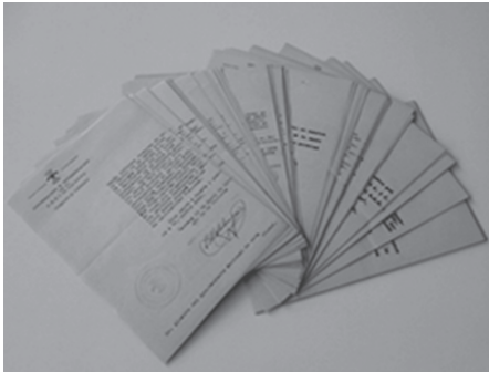
Informes repressius, signats per Emili Matalonga Cortes, Cap del Servei d'Informació de Falange. AHT-ACVOC: Fons Jutjat de Terrassa, núm. 1. Instrucció penal. Responsabilitats polítiques.

format part del Front Popular, establint la confiscació de tots els seus béns, que passarien a ser propietat de l'Estat, el Decret-Llei de 10 de gener de 1937; va crear una estructura administrativa responsable de les confiscacions: una Comissió Central de Béns Confiscats per l'Estat i altres Comissions a cada província.