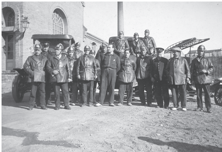
Els bombers de Terrassa, l'any 1927. Autor desconegut. Arxiu Bombers de Terrassa.