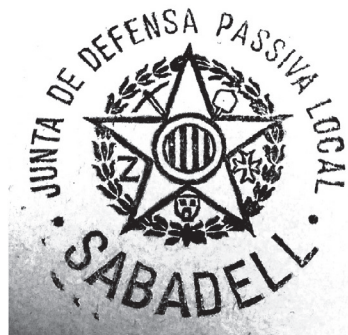
Segells de les Juntes Locals de Defensa Passiva de Granollers, Terrassa i Sabadell.

En el mes de desembre de 1936 es va instal·lar una sirena a l'Ajuntament per assenyalar la presència d'avions enemics. I al febrer 1937 la Junta Local de Defensa Passiva, mitjançant la Creu Roja, organitzava cinc concentracions