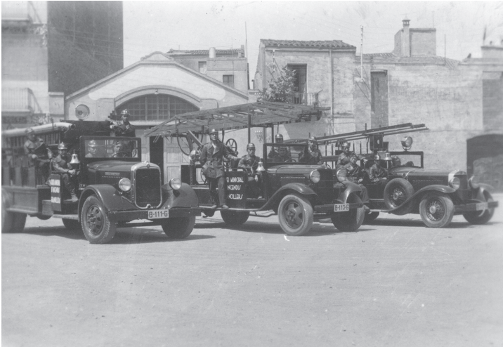
Els bombers de Granollers a la plaça de Pau Casals, el 2 de maig de 1937.

a transport de personal. El parc de bombers estava situat a la plaça Maluquer i Salvador.