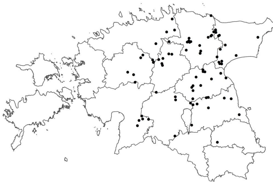
Joonis 1. Pruunkarude talvepesade (n=79) asukohad Eestis, 2003–2015.

Uuritud talvepesad (n=79) asusid peamiselt Kirde-, Ida- ja Kesk-Eestis. Kõige rohkem asus talvepesasid Lääne-Virumaal (21,5%) ja sellele järgnevad Jõgevamaa (16,5%), Ida-Virumaa (15,2%), Tartumaa (10,1%) ning Raplammaa (10,1%). Vähem talvepesasid asus Järva-, Viljandi-, Harju-, Pärnu- ja Põlvamaal.