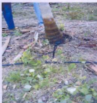
Fig. 2. Sistema de irrigação por microaspersão 47-50 litros/água/hora (R$ 2,00/microaspersor)