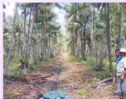
Fig. 4. Sistema de irrigação - 2 fileiras de plantio (10 anos)