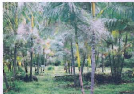
Fig. 3. Vista geral do experimento (4,0 anos)