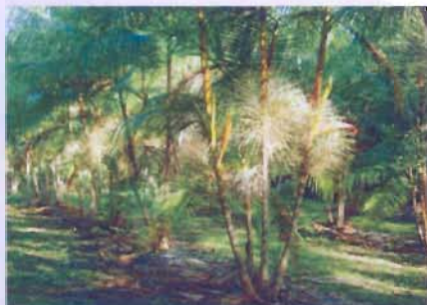
Fig. 1. Vista geral de experimento procedência Anajás (4,5 anos)