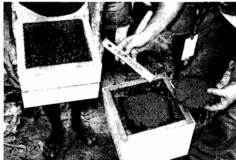
Sobreninho e melgueira de Melipona fasciculata .

Foram instalados meliponários utilizando-se caixas racionais na propriedade agrícola. No curso de capacitação o meliponário instalado foi utilizado para ministrar as aulas práticas. Amostras de méis produzidos na unidade estão sendo coletados para serem feitos estudos sobre as propriedades físico-químicas.