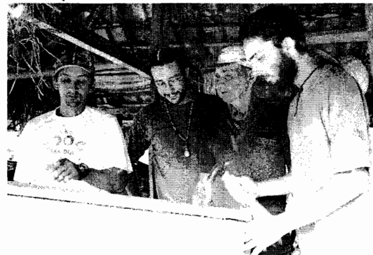
Visita de estudantes a meliponário de agricultor.

Mais informações no site http://mel.cpatu.embrapa.br