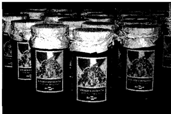
Mel pasteurizado pronto para comercialização.

Instalar meliponário modelo, utilizando caixas racionais desenvolvidas pelo CPATU para servir de unidades produtivas de base familiar modelo, utilizadas para capacitação, divulgação e fonte de dados para pesquisas sobre produtividade, análises físico-química de méis e tecnologia de produtos apícolas.