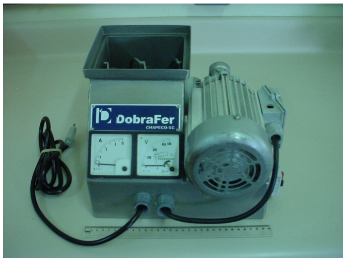
Figura 1 – Vista frontal do Mini Misturador Horizontal. (Foto: Gustavo J.M.M. de Lima).