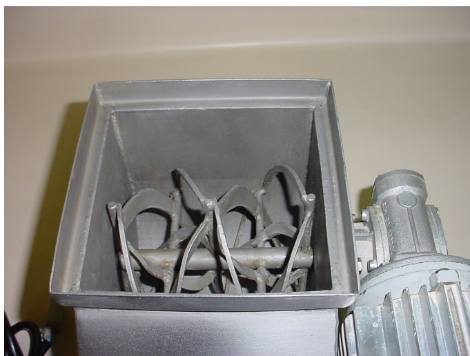
Figura 3 – Vista superior do Mini Misturador Horizontal.