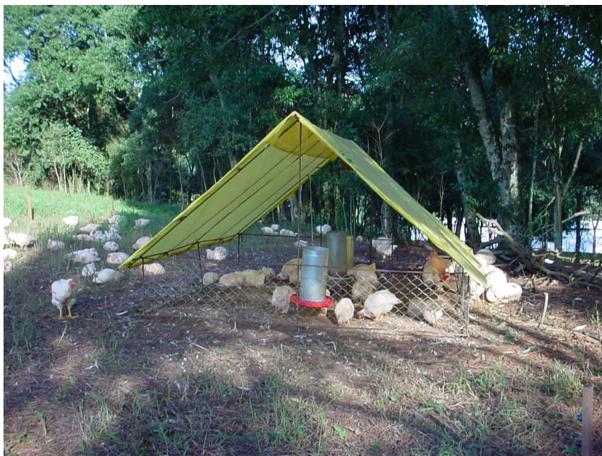
Figura 2 – Aviário sem cortina nas laterais e nos oitões, posicionado na projeção de sombreamento de árvores no período da tarde.