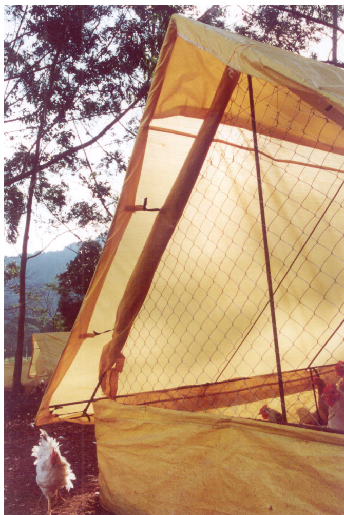
Figura 3 – Detalhes dos atilhos para fixação da lona de cobertura e abertura da cortina do oitão.