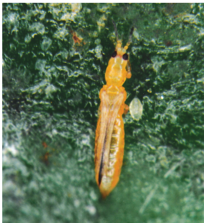
Figura 4. Tripes adulto da espécie Thrips palmi .

As fêmeas de T. tabaci são de coloração que varia do amarelo-claro ao marrom e possuem em torno de 1 mm de comprimento e 2 mm de envergadura (Figura 5). Têm asas longas, estreitas e franjadas, pernas mais claras que o corpo, abdome com 10 segmentos, ovipositor curvado para baixo e com vários "dentes". Cada fêmea põe de 20 a 100 ovos durante toda sua vida, que dura cerca de 20 dias. Esses insetos formam colônias e alimentam-se da seiva das plantas, colocando seus ovos nas