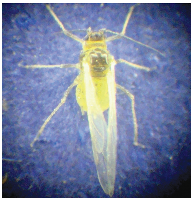
Figura 2. Pulgão da espécie Myzus persicae .

O pulgão-das-solanáceas M. euphorbiae é o maior das três espécies que ocorrem em pimenteira. Os indivíduos dessa espécie que não apresentam asas medem cerca de 3,5 mm de comprimento, apresentam coloração verde-claro e possuem as pernas e os sífúnculos com as extremidades escurecidas. As formas aladas são maiores, apresentando cerca de 4 mm de comprimento, coloração variando do verde-claro ao verde-escuro e antenas ultrapassando o tamanho do corpo. É relatado como vetor de mais de 40 espécies de vírus e tem sido encontrado em cerca de 50 espécies vegetais.