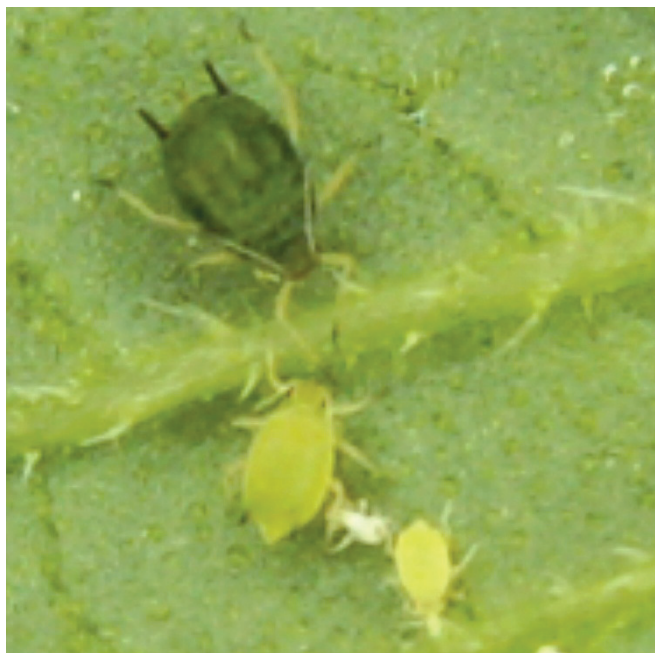
Figura 1. Pulgões da espécie Aphis gossypii .

O pulgão M. persicae também é considerado uma praga que ataca várias espécies vegetais, ocorrendo em vários países ao redor do mundo e pode atuar como vetor de mais de 100 espécies de vírus em diversas culturas. Os adultos dessa espécie têm cerca de 2 mm de comprimento, sendo a forma áptera (sem asas) de coloração geral verde-clara, enquanto a forma alada (com asas) apresenta coloração verde, com cabeça, antenas e tórax pretos. As ninfas são de coloração verde a marrom-avermelhado (Figura 2).