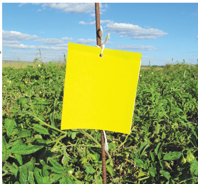
Figura 3. Placa amarela adesiva utilizada para atrair e capturar pulgões e moscas-brancas.

Pode-se, ainda, utilizar palha de arroz, capim seco ou plástico, como cobertura de solo, pois, além de proteger as plantas, esses materiais têm acentuado efeito na repelência de formas aladas migrantes, diminuindo as “picadas de prova” e, conseqüentemente, a transmissão de viroses.