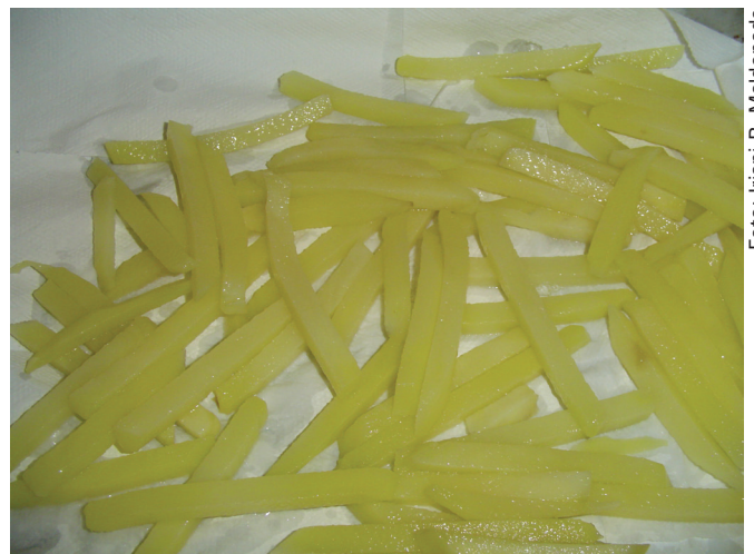
Figura 5. Secagem das batatas