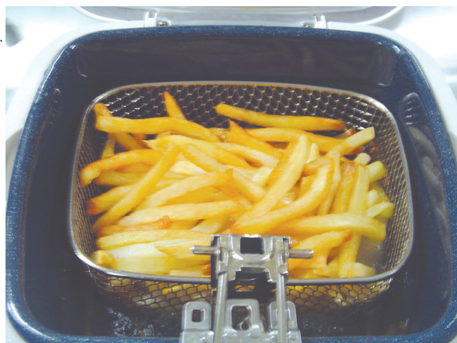
Figura 8. Batatas fritas após congelamento prontas para serem consumidas