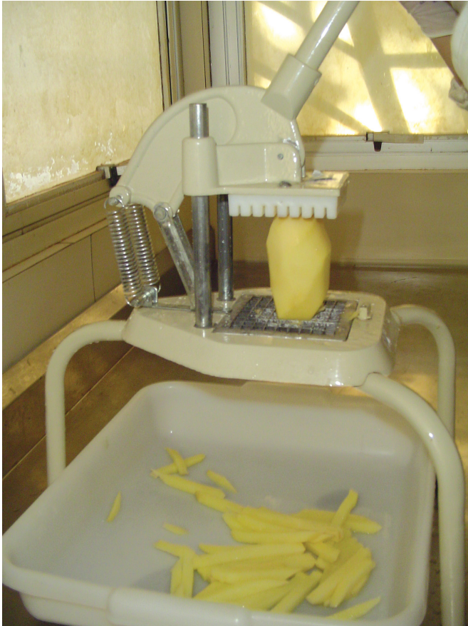
Figura 3. Fatiamento das batatas na forma de palitos