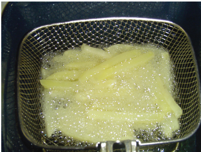
Figura 6. Pré-fritura das batatas

Em caso de reaproveitamento do óleo, coar o óleo com gaze limpa para a retirada de resíduos. O tempo de utilização do óleo não deve exceder a 10 etapas de frituras. Entretanto, caso a gordura ou óleo comecem a espumar e esfumaçar ou apresentar alteração na coloração e odor, então este deverá ser imediatamente trocado. A fritadeira ou frigideira deve ser limpa regularmente com produto detergente neutro e devidamente enxaguada antes do seu uso.