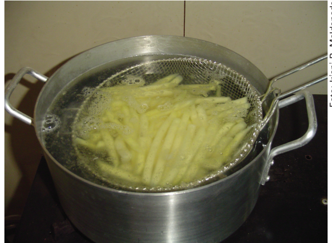
Figura 4. Branqueamento

imersas em banho de gelo por mais 2 minutos. Depois são colocadas em escorredor até secarem (Figura 5). Caso seja necessário, as batatas podem ser secadas com guardanapos de papel. É importante secá-las muito bem, pois em seguida serão fritas em óleo.