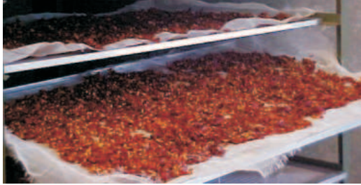
Fig.8. Pimentas desidratadas sendo resfriadas à temperatura ambiente.

No final do processo de secagem as pimentas desidratadas são retiradas do secador de cabine (Fig 8), sendo resfriadas à temperatura ambiente.