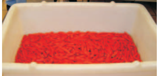
Fig.3. Lavagem com água clorada.