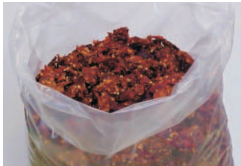
Fig.9. Pimentas acondicionadas em saco de polietileno de alta densidade.

Após o resfriamento as pimentas são acondicionadas em sacos de polietileno de alta densidade (Fig. 9).