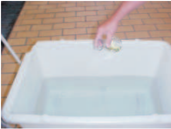
Fig.2. Água clorada.

As pimentas são, então, descarregadas neste tanque (Fig. 3) contendo a água clorada para retirada de resíduos como terra e poeira. Esta lavagem higieniza as pimentas possibilitando um maior controle sobre possíveis contaminações microbiológicas.