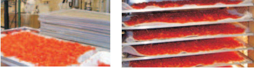
Fig.5. Pimentas trituradas dispostas nas bandejas.

A seguir, as pimentas trituradas são colocadas nas bandejas. As pimentas deverão estar distribuídas pela sua área, formando uma camada para facilitar a secagem (Fig. 5).