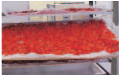
Fig.6. Bandeja colocada no carro com rodízio.

As bandejas são colocadas no carro com rodízio (Fig. 6) e levadas para o interior do secador de cabine (Fig. 7), que deve estar a uma temperatura de 60°C. O final da secagem é identificado quando toda a massa de pimenta não apresentar pontos localizados de umidade.