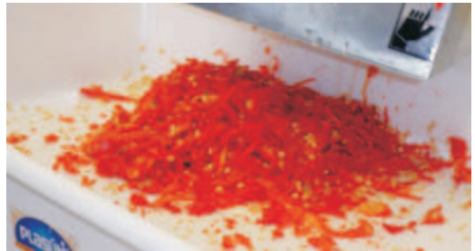
Fig.4. Processador de alimentos e pimentas trituradas.