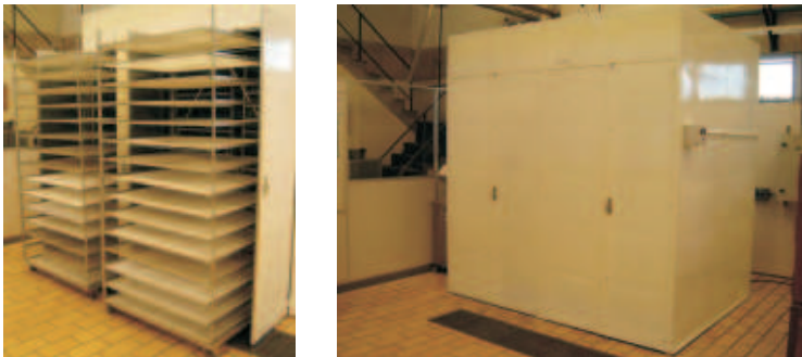
Fig.7. Secador de cabine com detalhe dos carros com rodízio.