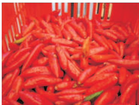
Fig.1. Pimentas dedo de moça, íntegras, amassadas e em decomposição.

Na recepção, os frutos deverão ser selecionados, sendo descartadas as pimentas amassadas e em decomposição (Fig. 1), pois estas comprometerão a qualidade do produto final.