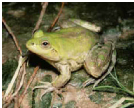
Fig. 1. Adulto de Pseudis paradoxa , Pantanal Sul.

Este estudo foi feito em um lago com alta concentração de sais e pH entre 9,0 a 9,9, na fazenda Nhumirim (18° 59' S; 56° 40' W) no Pantanal Sul, Brasil. No período de 1989 a 1999, os jacarés foram contados a noite e as densidades dos sapos ( Pseudis paradoxa ) foram estimadas no lago (salina). Considerei como alta densidade dos sapos quando a estimativa resultou em > 100 adultos e girinos/m 2 nas bordas do lago (Fig.1). Os jacarés foram capturados, marcados e soltos no lago.