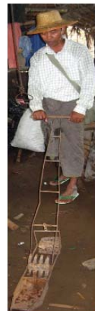
Figura 2.: Cultivador para controle mecânico de plantas daninhas em arroz irrigado. (a) produtores realizando o controle das invasoras antes do perfilhamento da cultura; (b) detalhes do modelo asiático de cultivador.