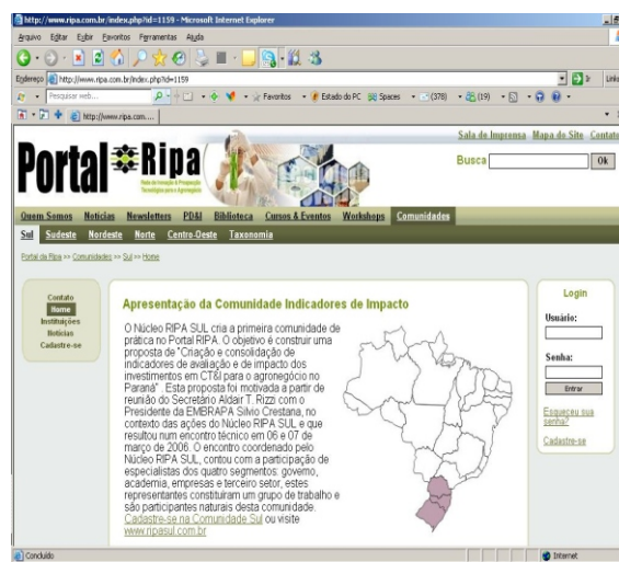
Figura 3 - Portal RIPA, com a aba sobre a Comunidade de Prática para a Região Sul selecionada.

A Figura 4 ilustra em diagramas de blocos a estruturação do conceito desenvolvido nos Workshops Regionais para a articulação das redes regionais com foco em produtos, processos e serviços, incluindo a própria articulação das parcerias. A base fundamentada é a de uma rede de cooperação estratégica para a prospecção tecnológica, com característica produtiva e educacional operando com foco em desenvolvimento sustentável e a geração de riquezas. Redes regionais integradas em uma rede nacional, conforme preconizado no modelo de rede de redes.