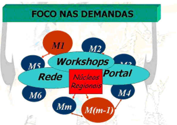
Figura 1 - Estrutura esquemática da RIPA, onde os M_i representam instituições ou competências conectadas à rede.