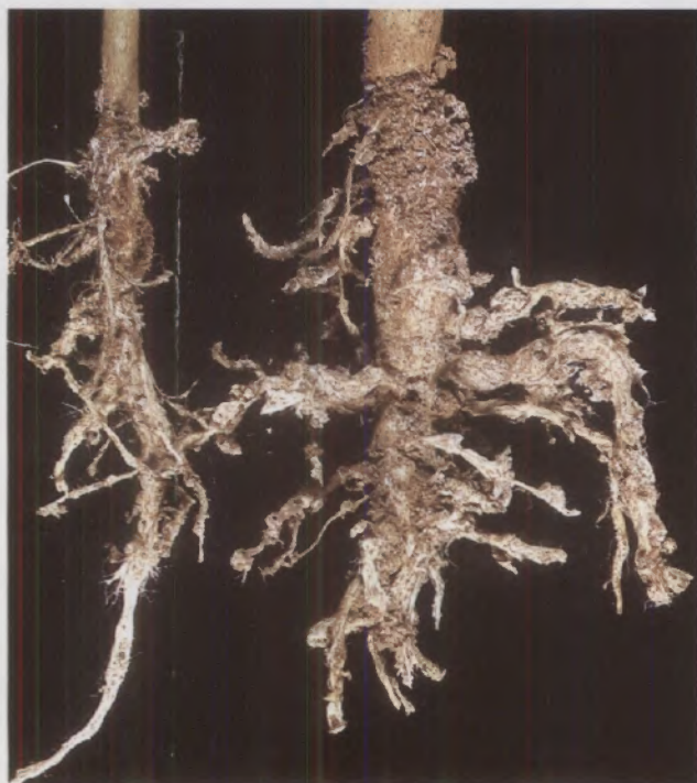
Fig.8 - Plantas de quiabo com morte prematura causada por interação de Meloidogyne javanica e Sclerotium rolfsii

A interação de nematóides com fungos ou bactérias, proporciona a intensificação de sintomas. A associação do nematóide Meloidogyne javanica com o fungo Sclerotium rolfsii causa a morte prematura de plantas de quiabeiro (Fig. 8). Em Infecções isoladas os patógenos colonizam as raízes de quiabeiro, mas não matam a planta.