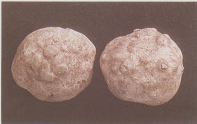
Fig.4 - Tubérculo de batata com galhas causadas por Meloidogyne javanica

A podridão de bulbos de diversas culturas da família Alliaceae é o sintoma típico causado pela espécie Ditylenchus dipsaci , denominado como nematóide da haste e bulbo. No campo, o nematóide causa a podridão de bulbos de alho e cebola e no armazenamento, o nematóide Ditylenchus causa o sintoma típico de amarelão, caracterizado pela intensa cor amarelada das escamas do bulbo de alho, resultando no chochamento rápido que inviabiliza os bulbilhos para o plantio e consumo (Fig. 6).