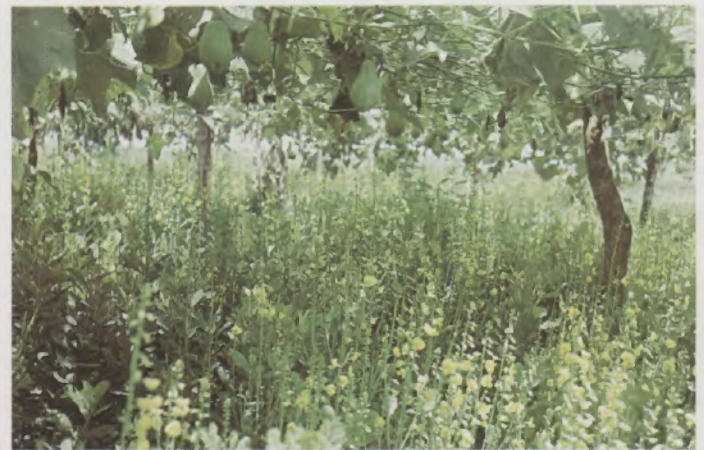
Fig.9 - Plantas de chuchuzeiro consorciadas com Crotalaria spectabilis

O plantio de leguminosas como crotalaria, estilosantes e mucuna-preta, não hospedeiras dos nematóides das galhas, sob a latada e 30 dias antes do plantio do chuchuzeiro, proporcionam melhor condição físico-química do solo, pela habilidade que tem estas leguminosas na produção de Rhizobium para fixação do nitrogênio do ar no solo. Em presença de nitrogênio, as raízes do chuchuzeiro tornam-se mais vigorosas e toleram melhor à infecção por nematóides das galhas. A consorciação de Crotalaria spectabilis em plantios de chuchuzeiro proporcionou o aumento de 55% na produção de chuchu, em comparação com plantas não consorciadas (Fig. 9).