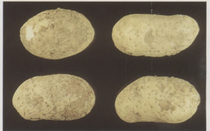
Fig.5 - Tubérculos de batata com pinta causadas por Pratylenchus brachyurus

A podridão de bulbos de diversas culturas da família Alliaceae é o sintoma típico causado pela espécie Ditylenchus dipsaci , denominado como nematóide da haste e bulbo. No campo, o nematóide causa a podridão de bulbos de alho e cebola e no armazenamento, o nematóide Ditylenchus causa o sintoma típico de amarelão, caracterizado pela intensa cor amarelada das escamas do bulbo de alho, resultando no chochamento rápido que inviabiliza os bulbilhos para o plantio e consumo (Fig. 6).