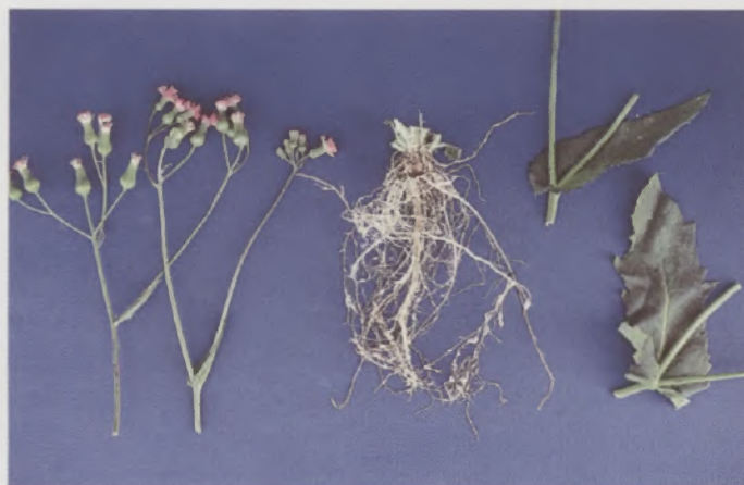
Fig.11 - Planta daninha do gênero Emilia (falsa-serralha)

períodos de até 1 ano. Os nematóides são parasitas obrigatórios que precisam da planta hospedeira para completar o ciclo de vida. Na sua ausência os nematóides fitoparasitas morrem de fome. No pousio da área, são feitas arações e gradagens sucessivas para eliminação de plantas daninhas de folhas largas dos gêneros Emilia (falsa-serralha) e Solanum (juá-bravo e arrebenta-cavalo), que são hospedeiras dos nematóides das galhas. A permanência dessas plantas hospedeiras propicia a reprodução dos nematóides na ausência da cultura (Fig. 11).