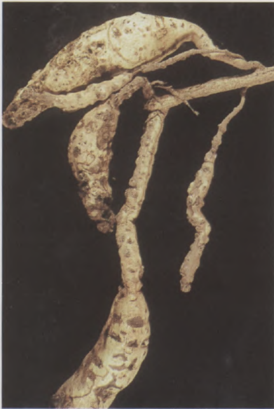
Fig.3 - Raízes tuberosas de batata-doce com galhas causadas por Meloidogyne incognita

A lesão necrótica em tubérculos é sintoma de pinta enegrecida na região de lenticela do tubérculo, causada por nematóides do gênero Pratylenchus (Fig. 5). É um sintoma que se confunde com o da doença conhecida como lenticelose da batata.