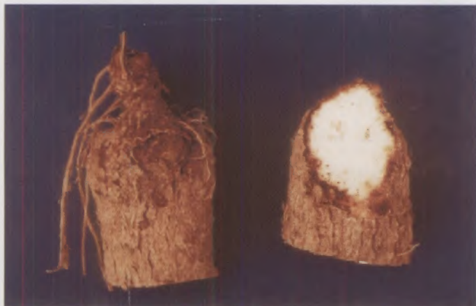
Fig.7 - Túberas de inhame com casca preta causada por Scutellonema bradys

expansiva, localizada na camada de 1 a 2 cm de espessura na superfície de túberas de inhame em campo e no armazenamento. A doença inviabiliza o inhame para exportação, mas não para o consumo interno (Fig. 7).