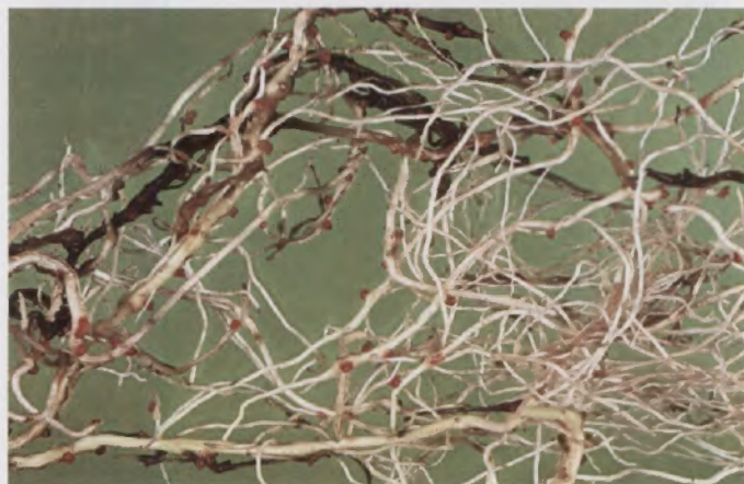
Fig.10 - Sistema radicular de batata-doce com massas de ovos de Meloidogyne incognita sem formação de galhas

O plantio de plantas que escondem a infecção por nematóides, conhecidas como falsa hospedeiras deve ser evitado em solos infestados. A batata-doce é considerada como exemplo típico de falsa hospedeira, por sua habilidade em acumular grande número de massas de ovos de nematóides do gênero Meloidogyne no sistema radicular, sem que o sintoma de galhas seja observado. A batata-doce suscetível é fonte de inóculo em potencial de nematóides do gênero Meloidogyne para culturas subseqüentes (Fig. 10).