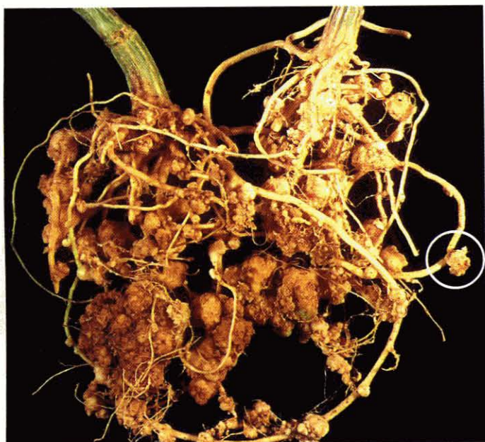
Fig. 1 - Sistema radicular do tomateiro com galhas de Meloidogyne javanica