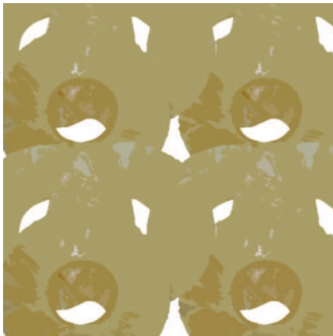
Ilustração: Marcos Moulin

Virgínia Martins da Matta 1 Tatiana Vidal Candéa 2 Rodrigo Paranhos Monteiro 3 Daniela de Grandi Castro Freitas 4 Ana Lúcia Penteado 5