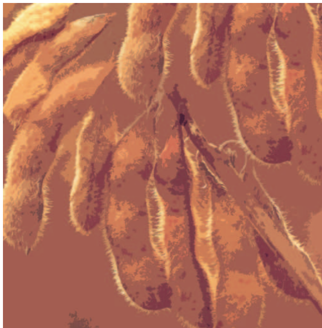
Ilustração: Marcos Moulin

ISSN 0103-5231 Dezembro, 2010 Rio de Janeiro, RJ