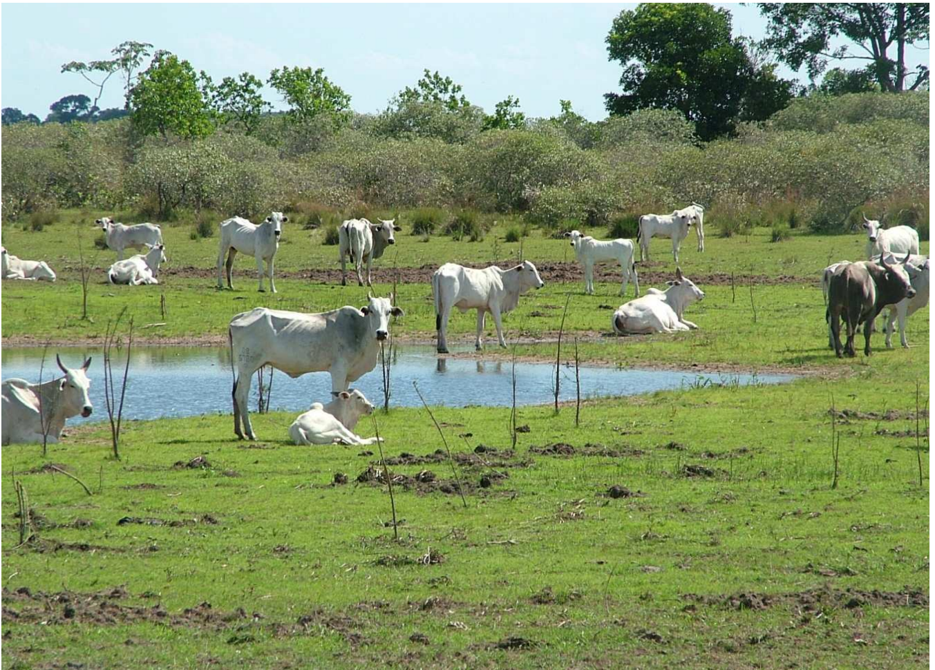
Figura 1. Gado de cria em pastagem nativa da região do Pantanal.