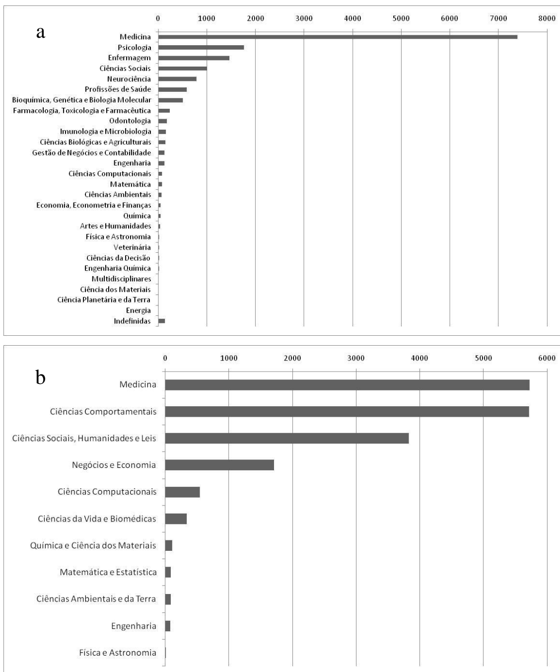
Figura 2. Bibliometria (quantificação de número de registros por área do conhecimento) da palavra “cronbach” nos sítios de busca: a) Scopus ( www.scopus.com ) e b) SpringerLink ( www.springerlink.com ).

A figura 2 mostra a utilização do Coeficiente \alpha de Cronbach por área de conhecimento. Os sítios pesquisados apresentam diferenças no sistema de classificação das áreas, portanto os resumos e artigos encontrados se apresentam distribuídos de forma distinta nos dois sítios, resultando em 28 áreas diferentes para o sítio Scopus e 11 áreas diferentes para o sítio SpringerLink. Em