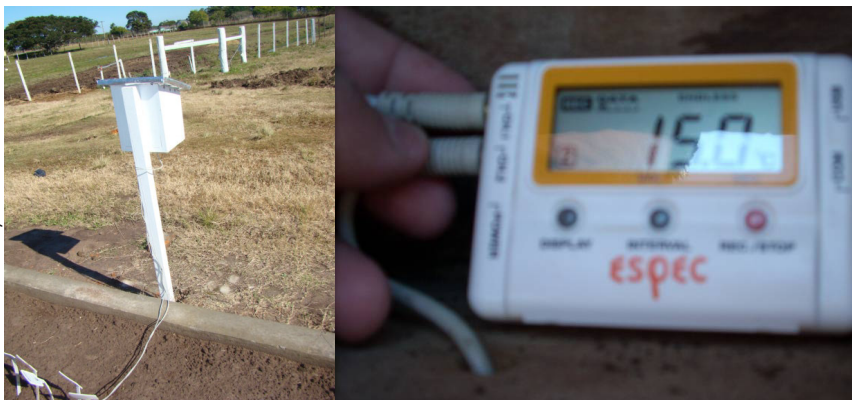
Figura 2. Disposição dos termistores usados para registrar as temperaturas do solo, na profundidade de 5 cm. Embrapa Clima Temperado, Estação Terras Baixas, Pelotas/RS, 2010.