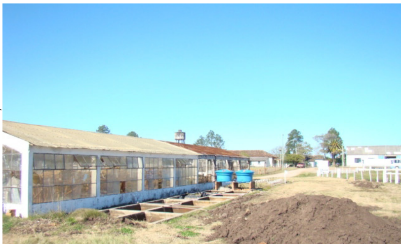
Figura 1. Tipos de tanques utilizados para realização do experimento de tratamento de sementes. Embrapa Clima Temperado, Estação Terras Baixas, Pelotas/RS, 2010.