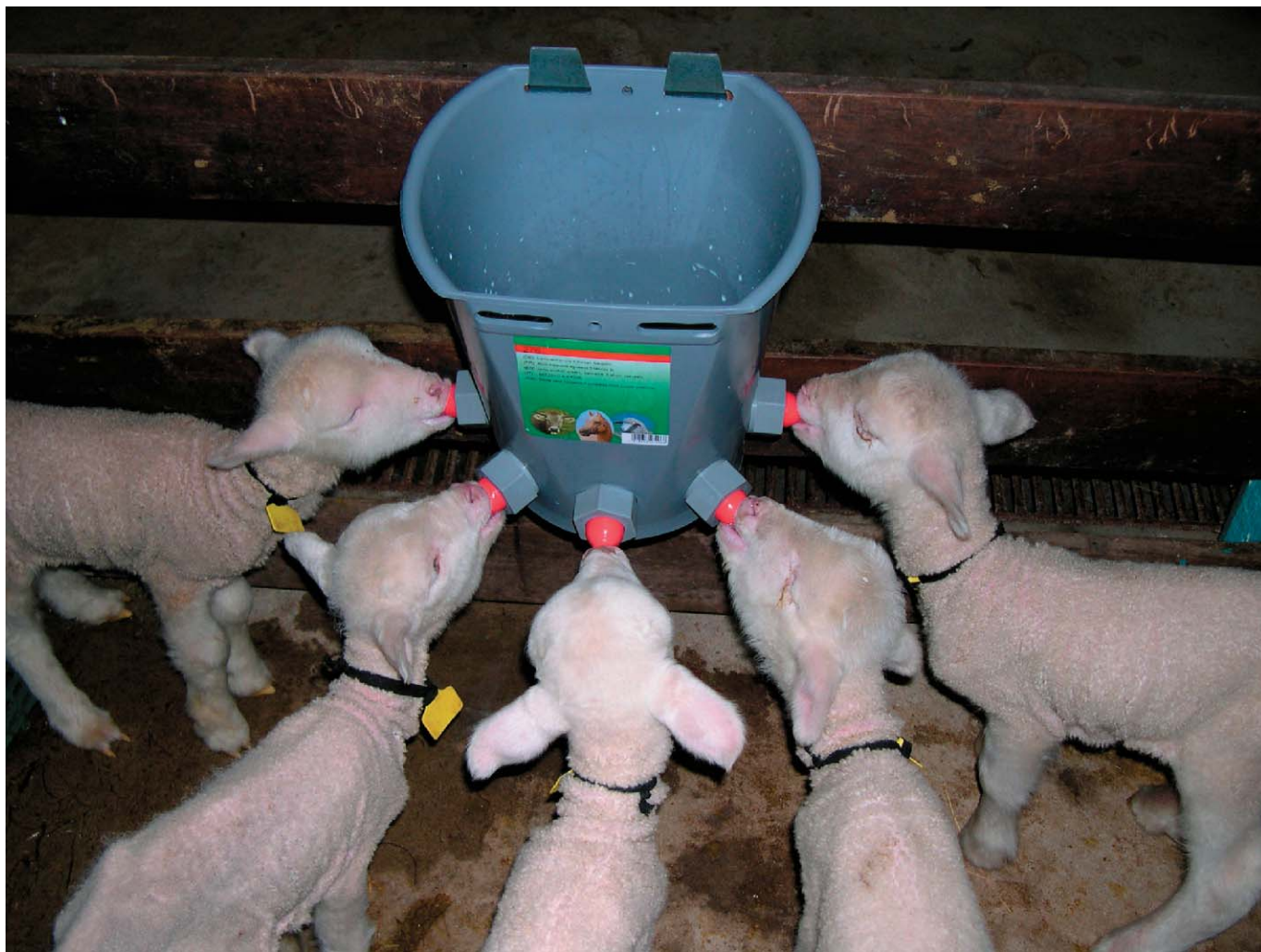
Figura 5. Cordeiros sendo aleitados artificialmente com leite de vaca.

No caso de cordeiros que estão sendo aleitados artificialmente é interessante começar a oferecer ração aos animais após a primeira semana de vida. Oferecer ração para ovinos e que não tenha nitrogênio não proteico (uréia) como fonte de proteína, no volume equivalente a 1% do peso do cordeiro. Por exemplo, um cordeiro com 5 quilos deve receber diariamente 50g de concentrado, que deve trocado todos os dias mesmo que o animal não tenha comido todo o volume oferecido.