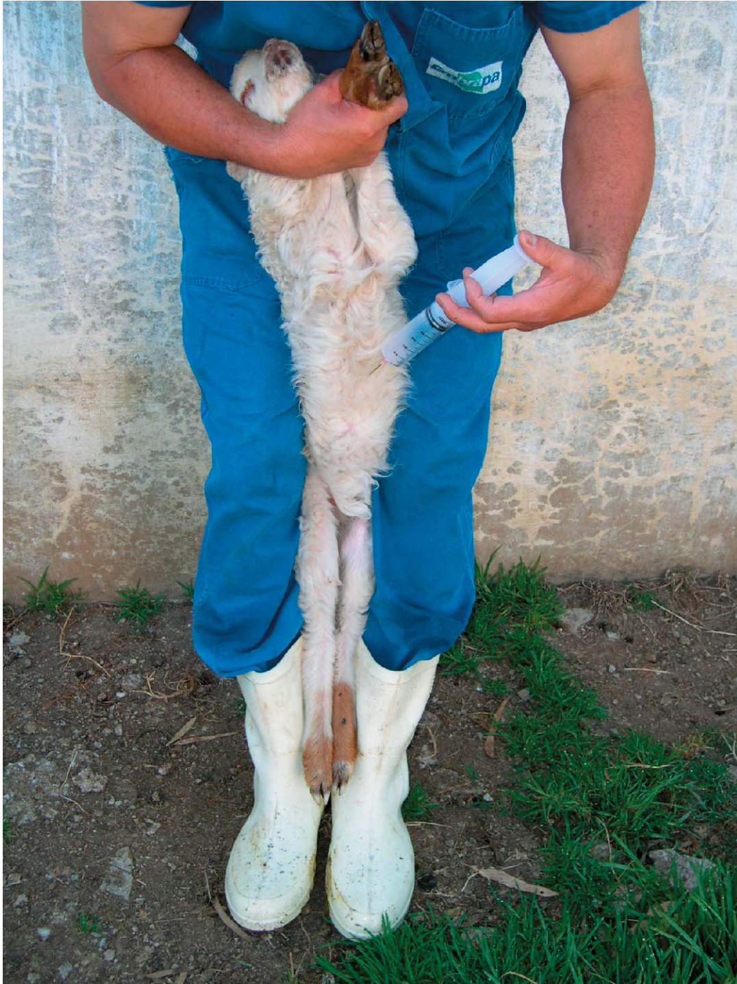
Figura 3. Posição do aplicador e local onde deve ser aplicada a injeção intraperitoneal de glicose 20%.

Quando for necessário utilizar a sonda estomacal (SOUZA; MORAES; JAUME, 2005) deve ser considerada a idade do cordeiro, pois animais com até um dia de vida e especialmente os com menos de 5 horas de vida devem receber colostro (Figura 4). Para tanto é importante que se crie um banco de colostro congelado para atender estes animais. O colostro para o banco deve ser colhido de ovelhas que tenham perdido seus cordeiros ou das ovelhas que pariram um só produto e que tenham produzido excedente de colostro após atender sua cria.