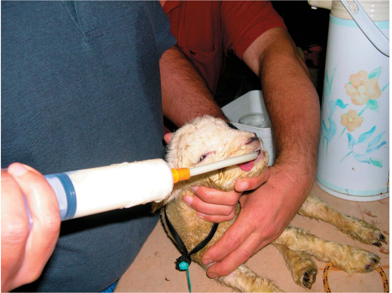
Figura 4. Cordeiro recém-nascido recebendo, por sonda estomacal, colostro descongelado.

Lembrar que cada cordeiro deve receber pelo menos 30 ml por quilo de peso vivo nas primeiras 6 horas de vida, caso não se tenha certeza que ele tenha mamado esta quantidade, administrar para garantir a transferência de imunidade para o animal.