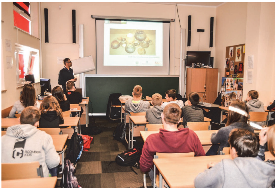
Ryc. 2. Prezentacja poświęcona społecznej wrażliwości i potocznej wiedzy o zabytkach: zajęcia dla uczniów klasy 3. gimnazjum w Bobolicach

Dużym zainteresowaniem cieszył się również bezpośredni kontakt młodzieży z zabytkami – młodzież mogła zbliżyć się do dziedzictwa podczas prezentowania fragmentów pradziejowych naczyń ceramicznych – co sprzyjało realizacji zasady,