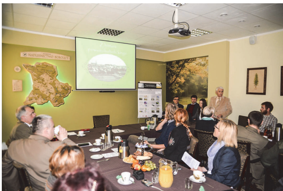
Ryc. 1. Uczestnicy sesji popularno-naukowej „Dziedzictwo archeologiczne ziem boboliczkiej i polanowskiej: rozpoznanie, potencjał, perspektywy w Bobolicach” podczas obrad

sowane w trakcie badań archeologiczne metody prospekcji terenu, uzyskane w ich trakcie rezultaty oraz proponowane formy wykorzystania informacji o stanowiskach archeologicznych dla rozwoju turystycznego regionu Bobolic. Po zakończeniu sesji był on prezentowany w budynku Urzędu Miejskiego w Bobolicach. Na potrzeby sesji przygotowana została również broszura informacyjna o wybranych stanowiskach i obiektach archeologicznych, z wykorzystaniem materiału ilustracyjnego i graficznych wizualizacji, opracowanych na podstawie zasobów uzyskanych w wyniku nieinwazyjnych badań archeologicznych, podejmowanych w ramach projektu (Pawleta 2015b).