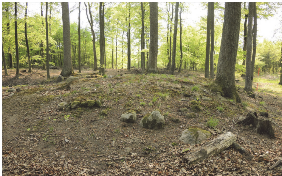
Ryc. 4. Skupisko kurhanów kamienno-ziemnych na terenie Leśnictwa Łanki Fig. 4. A cluster of stone and earth barrows in the area of the Łanki forestry commission

Tego typu ochroną – z racji na stan zachowania oraz grupowanie się na niewielkiej przestrzeni w wyraźny zespół – powinno zostać objęte skupisko nieznanych wcześniej dziewięciu kurhanów z wyraźnie prostokątnymi obstawami kamiennymi i nasypami ziemnymi o wysokości 1–1,5 m, odkryte na terenie pasieki w Leśnictwie Łanki – Buszynko Pierwsze (stan. 2). Wśród kurhanów wystąpiły dwa znacznie większe (ok. 15 m × 6 m), pozostałe siedem jest mniejszych rozmiarów (ok. 6 m × 4 m) (ryc. 4).