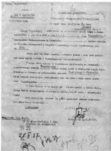
Ilustracja 3. Pismo dokumentujące rejestrację przez dokonanie wpisu do Rejestru Stowarzyszeń i Związków Poznańskiego Urzędu Wojewódzkiego w Poznaniu

Warto zwrócić uwagę na trzy cele, które PTP sobie postawiło: praca naukowa członków, rozpowszechnianie wiedzy pedagogicznej i psychologicznej oraz wprowadzanie jej w praktykę życiową. Jeden ze sposobów, w jaki Towarzystwo miało realizować swoje zadania, jest wymieniony w paragrafie 2, części B, pkt. 6 Statutu – wydawanie własnych wydawnictw. „Biuletyn Poznańskiego Towarzystwa Pedagogicznego” był prawdopodobnie jedyną publikacją, jaką udało się Towarzystwu wydać.