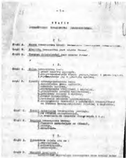
Ilustracja 4. Pierwsza strona Statutu Poznańskiego Towarzystwa Pedagogicznego